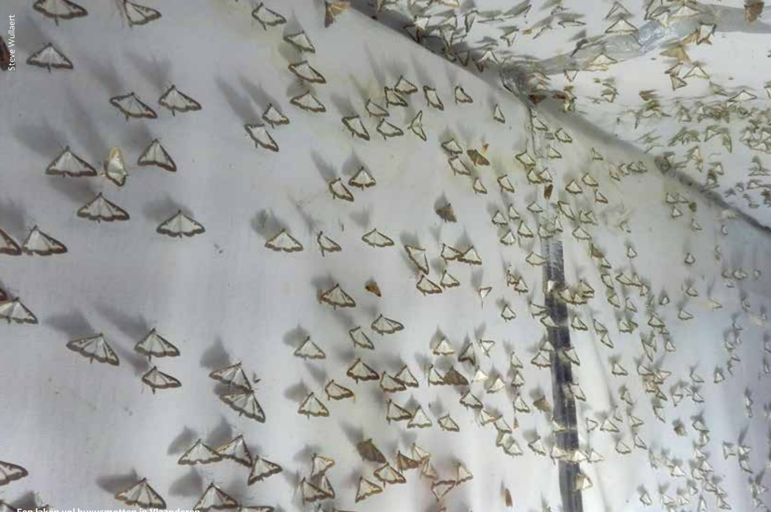
Een jaken vol buxusmotten in Vlaanderen.

struik die minder gevoelig is voor kaalvraat zoals de liguster. Ook zijn er mensen die heel systematisch de rupsen en eventueel poppen uit de struiken verwijderen en zo ook vervolgschade klein houden. Er zijn ook feromoonvallen in de handel. Hierin zit de specifieke sekslokstof van vrouwtjes die de mannetjes van de buxusmot aantrekken. Deze vliegen in de val en kunnen daar niet meer uit.