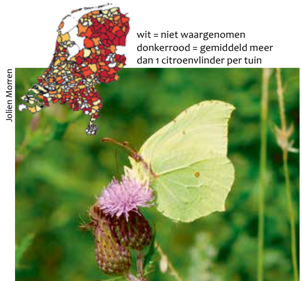
In het oosten van het land werden veel citroenvlinders gezien.

De atalanta is de meest waargenomen vlinder van de Tuinvlindertelling 2017, elk jaar hetzelfde liedje lijkt het wel. Toch valt dat nog wel mee. Afgelopen drie jaar was het telkens de atalanta, maar van de eerste zes edities van de Tuinvlindertelling won de kleine vos er vier. Daarmee staat de kleine vos nog steeds in de boeken als recordhouder. En wie weet, misschien heeft de distelvlinder in 2018 wel weer een goed jaar en eindigt hij op de eerste plek, net als in de eerste Tuinvlindertelling in 2009.