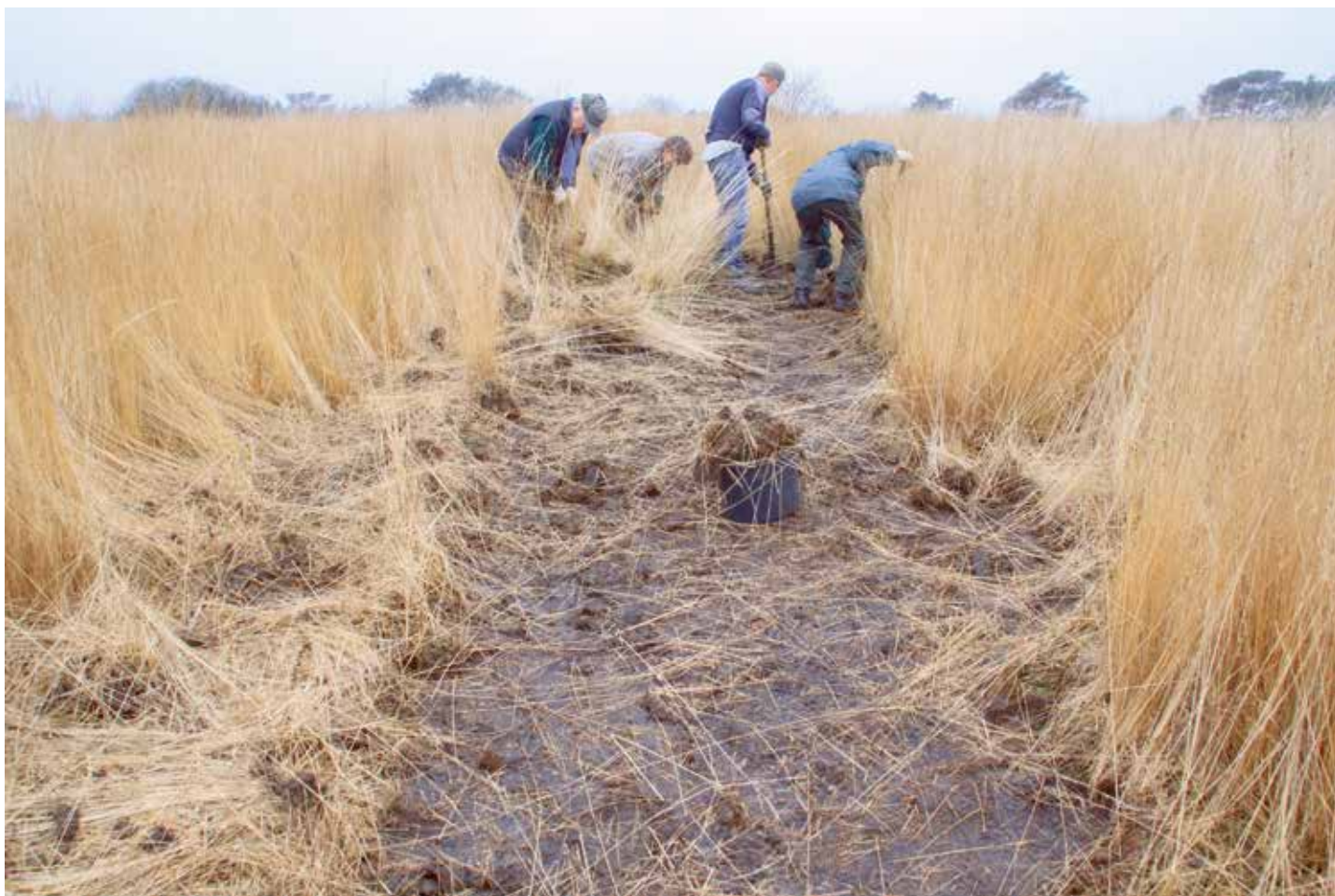
Kleinschalig 'klimaatplaggen' kan werken: op De Hoge Veluwe maakten vrijwilligers in december 2014 een plagstrook van laag naar hoog en deze zomer werden daar niet alleen veel gentianen, maar ook de eerste eitjes van het gentiaanblauwtje gevonden!

droogte als wateroverlast. Hoe die doorwerken op het gentiaanblauwtje laat zich deels nog raden, maar de effecten tekenen zich wel steeds duidelijker af. Vorig jaar was in Noord-Brabant de wateroverlast evident. Tot in augustus stonden er nog gentianengroeiplaatsen blank: zelfs wanneer de gentianen en de knooppieren dat overleven, wordt het onmogelijk voor een rups om de overstap van gentiaan naar miennest te maken. Ook afzonderlijke hoosbuien in de vliegtijd kunnen negatief uitpakken voor de overleving van de toch al kort levende vrouwtjes.