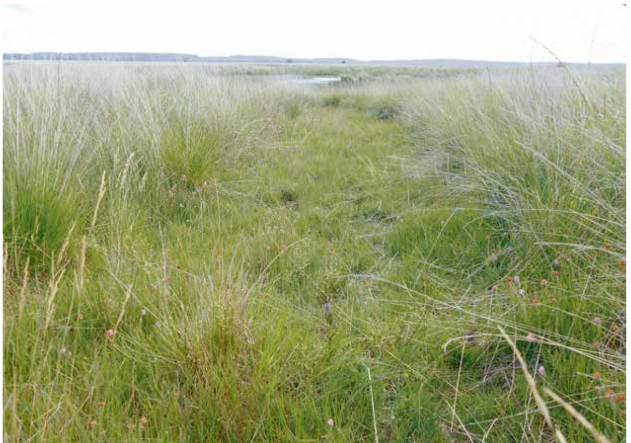
Plagstrook op de Hoge Veluwe met gentianen en eerste eitjes.