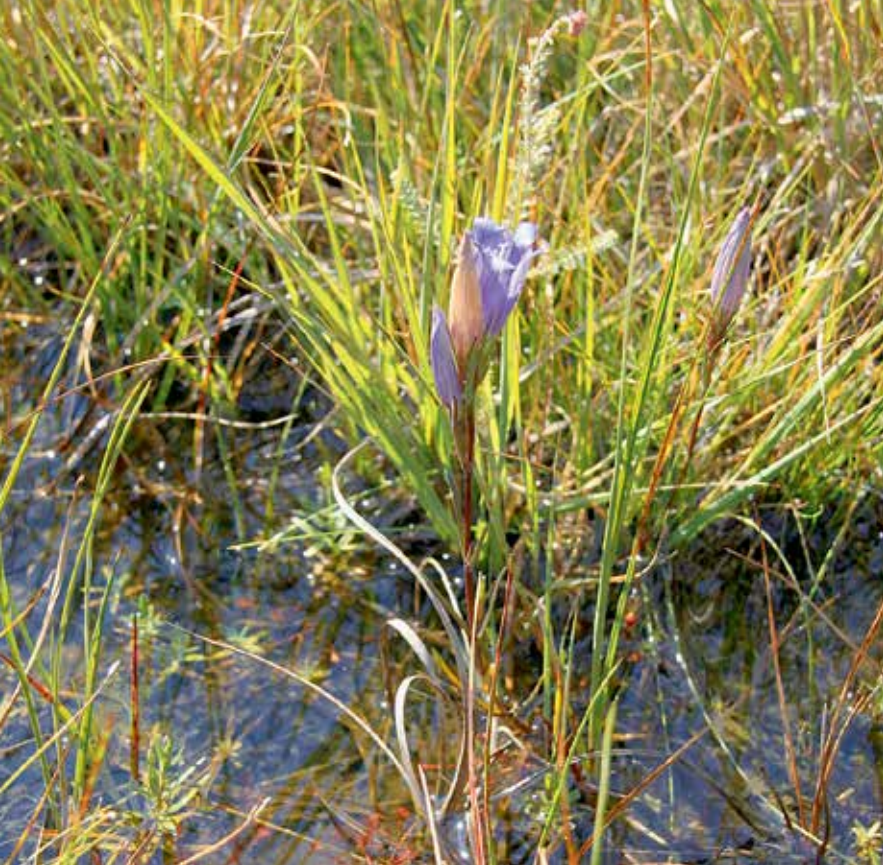
Bij extreme neerslag in de zomer kan de overstap van jonge rupsjes tussen gentiaan en mierennest letterlijk in het water vallen.

voor het gentiaanblauwtje. Niet alleen de natte heide en randen van hoogvenen, vooral ook de blauwgraslanden in het laagveengebied en de flanken van beekdalen en zelfs de duinen boden geschikt leefgebied. De lage productiviteit en het traditionele landgebruik van hooien en beweiden zorgden voor een grote landelijke verspreiding. Met de ontginning van de 'woeste gronden' en de daaropvolgende groene revolutie veranderde dat drastisch. Niet alleen ging veel leefgebied verloren, ook raakten leefgebieden ruimtelijk versnipperd en geïsoleerd van elkaar. Voor een gentiaanblauwtje is vijf kilometer al een enorme afstand. Vroeg of laat sterven de geïsoleerde populaties dan ook uit. En ook al verdwijnen ook de verbonden populaties, de afname bij de geïsoleerde populaties is veel sterker. In 1990 was nog 33% van de populaties geïsoleerd (restanten van vroegere populatienetwerken), tegenwoordig geldt dat nog maar voor 11% van de populaties (Figuur 2).