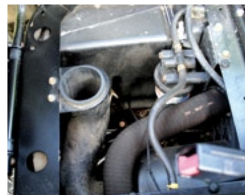
De luchtinlaat van de motor zit onder de rijderszitting.