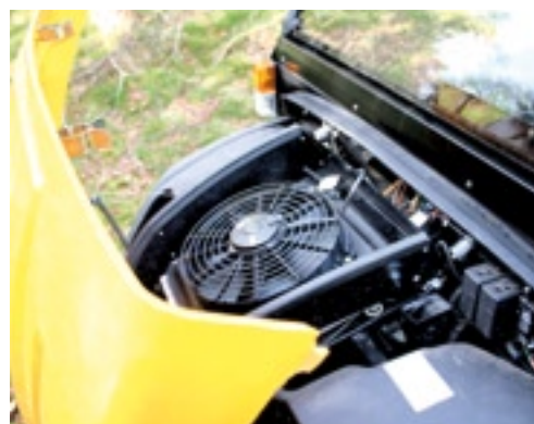
Onder de kap aan de voorkant zit de radiator met ventilator en de meeste elektronica.