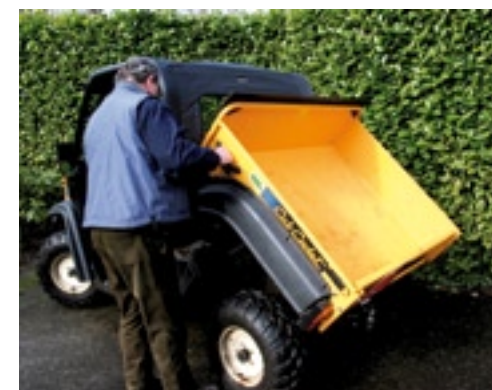
De laadbak kiep je met de hand. Optioneel kun je een elektrische cilinder plaatsen.