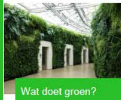
Wat doet groen?