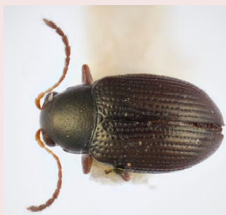
Figuur 6. Volwassen Epitrix tuberis.