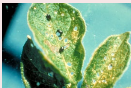
Figuur 7. Epitrix -schade aan blad van aardappel.