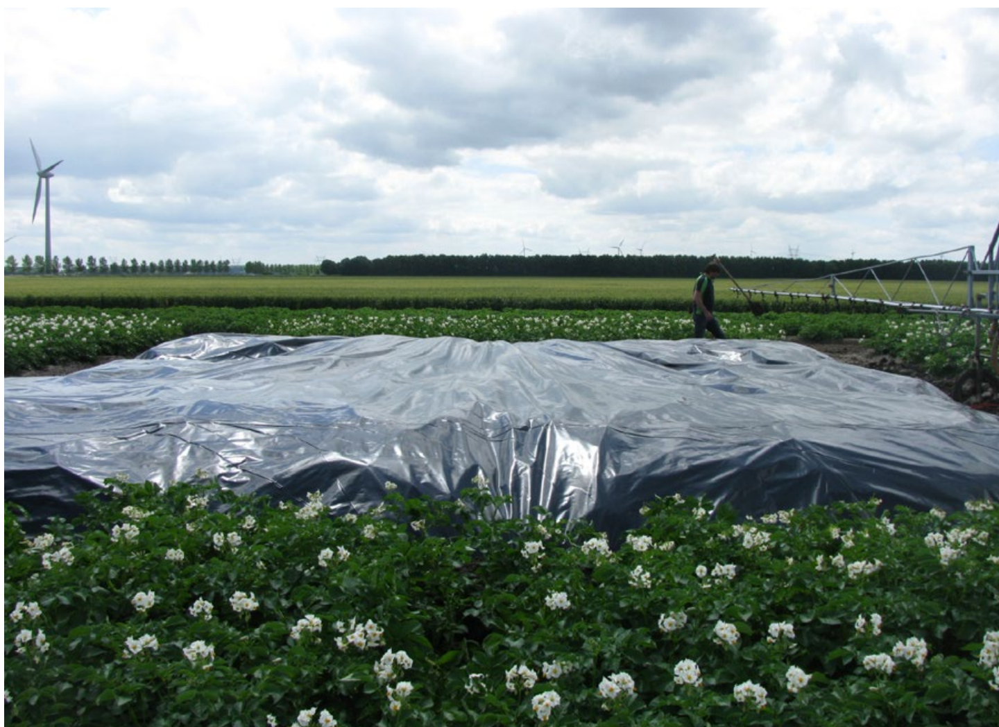
Figuur 11. Proefopzet Wageningen University & Research voor biologische grondontsmetting met 'herbie' tegen bladhaantjes ( Chrysomelidae ).

de zeer kleine kevers in grond of in de verpakking kan over het hoofd worden gezien. Dit leidt niet direct tot vestiging omdat de overleving en vestiging afhankelijk is van waardplanten in de omgeving van importlocaties. Kevers van Epitrix kunnen echter lang overleven zonder waardplant, dus is het verstandig rond importlocaties eventuele vestiging snel te detecteren. Het gebruik van specifieke lokvallen kan hierbij helpen. Door Economische Zaken gefinancierd onderzoek heeft de afgelopen jaren daarvoor de mogelijkheden onderzocht in samenwerking met Portugese onderzoekers. Het onderzoek richtte zich op het vinden van lokstoffen en geschikte vallen.