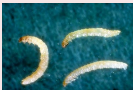
Figuur 4. Larven van Epitrix tuberis.