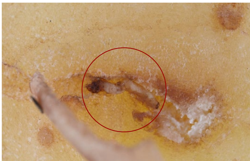
Figuur 1. Dode larve van Epitrix op aardappelen uit Andalusië (Spanje), onderscheept door het Verenigd Koninkrijk (Foto: VK, FERA Science Ltd., 2015).

De belangrijkste verspreidingsroute van de Epitrix -soorten is transport van aardappelen met (aanhangende) grond en de noodmaatregelen houden onder andere in dat vanuit besmette gebieden uitsluitend aardappelen mogen worden verhandeld indien ze na borstelen of wassen praktisch vrij zijn van grond.