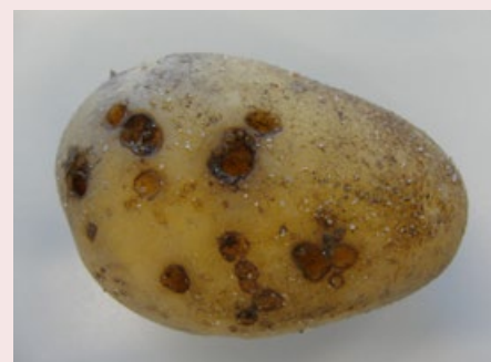
Figuur 9. Putten veroorzaakt door Epitrix (Foto: NVWA).