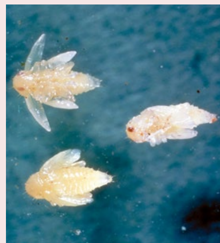
Figuur 5. Poppen van Epitrix tuberis.