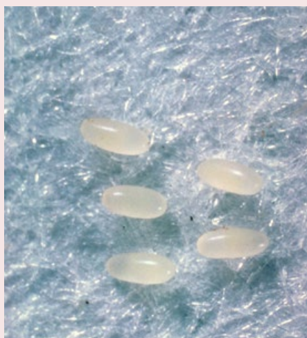
Figuur 3. Eieren van Epitrix tuberis.

Epitrix papa en E. cucumeris zijn net als andere aardvlooien zeer klein. De kevertjes zijn 1,5 - 2 mm groot, en springen over korte afstanden als 'vlooien' van plant naar plant. Ze zijn zwart tot bronsachtig van kleur, eirond met een kleine driehoekige kop en langwerpige ovale ogen, behaard en glanzend of dof van uiterlijk. Het halsschild is breed ten opzichte van de dekschilden en bevat talrijke kleine putjes. Grotere putjes staan ook in rijen op de dekschilden. Eieren zijn zeer klein en licht doorsichtig wit van kleur. Larven zijn 2 - 4 mm groot en bleekgeel van kleur met een (licht) bruine kop. De poppen zijn 1,5 - 2 mm groot en wit van kleur.