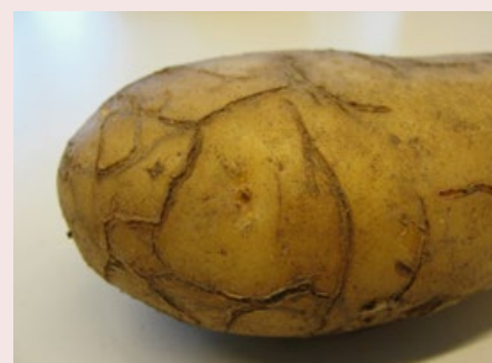
Figuur 8. Oppervlakte gangen veroorzaakt door Epitrix.