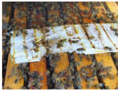
One-shot behandeling (herhaald)