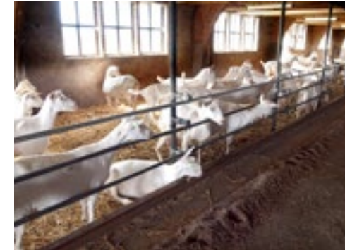
De jaarlingen zijn gehuisvest in de oude stal op het erf.