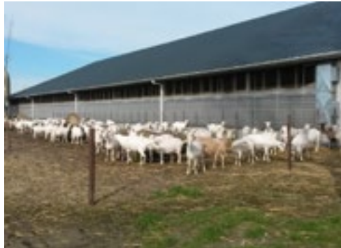
Alle geiten kunnen naar buiten. Dit is een van de uitlopen.