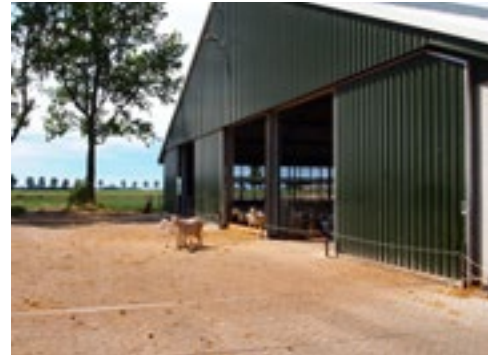
Als de geiten worden gemolken, moeten ze via het erf naar de andere stal lopen.