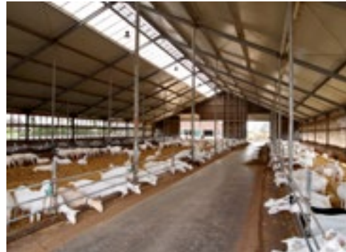
De ruime, lichte stal met geïsoleerd dak voldoet aan de MDV-eisen.