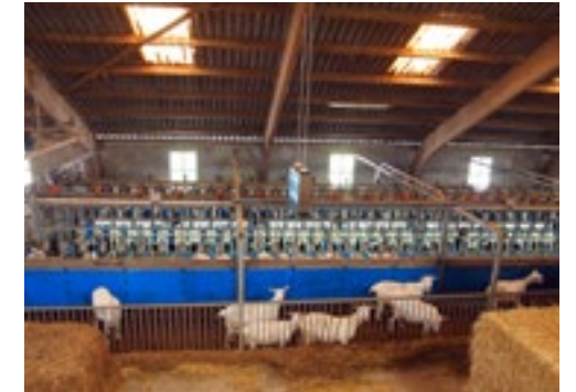
Ook de melkstal heeft een plek gekregen in de stal die al op het erf stond.