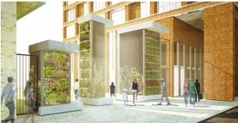
Artist impression van de nog te realiseren groene 'wachters' van Vertiverde bij de ingang van het plein.