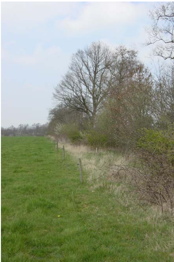
“met mantel en zoom meer ecologische inches”

Het is een hachelijke zaak om op voorhand de omvang van de bestedingen die aan de aanwezigheid van de voorgestelde wandelvoorzieningen te danken zullen zijn, te begroten. Vooreerst lijkt een effect op de omzet van nabijgelegen Horecagelegenheden zeker tot de mogelijkheden te behoren. Een en ander zal ook in belangrijke mate afhangen van de wijze waarop (gevestigde en nieuwe) ondernemers op het nieuwe gegeven inspelen.