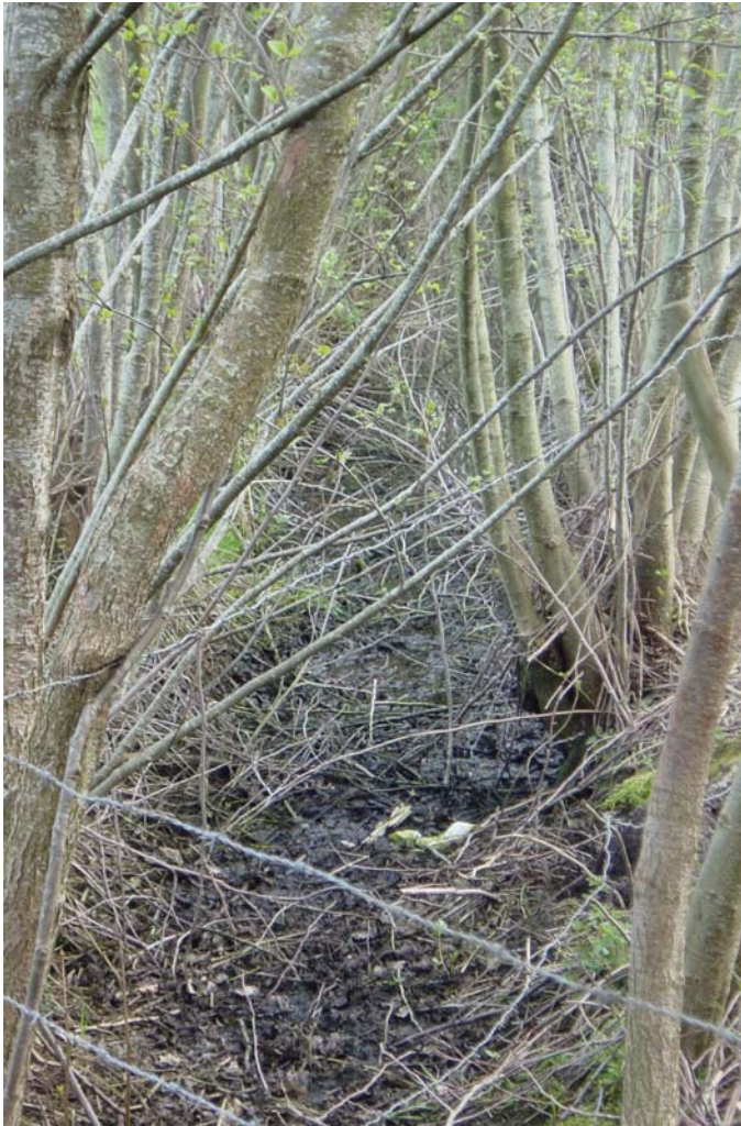
Onder gesloten elzingsingel geen plantengroei