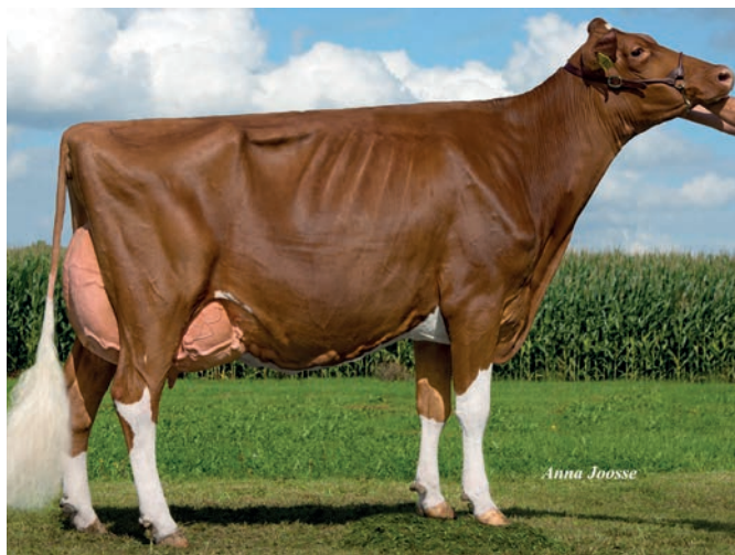
Merwehoeve Alana 5 (v. Amor). Prod.: 3.02 462 13.787 5,14 4,24