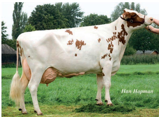
DCH Alumette (v. Lightning). Prod.: 4.00 305 13.098 4,61 3,41

hebben we haar toen met Amor gepaard, omdat ik dat wel een goede combinatie vond.' De gewaardeerde Bertildochter vertrok afgelopen juli na een productie van 60.000 kg melk. 'Je zag in Alana 2 de levensduur van de familie terug. Ze had zes keer gekalfd, maar het bleef een erg vitale koe.'