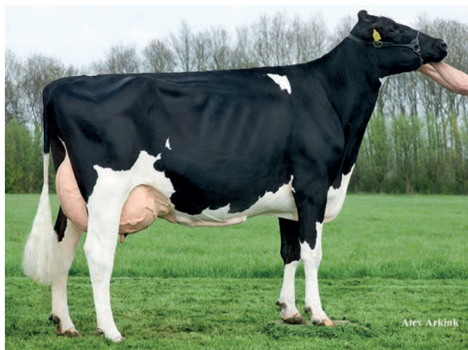
Delta Alana (v. Ramos). Prod.: 7.03 15.569 3,33 3,22