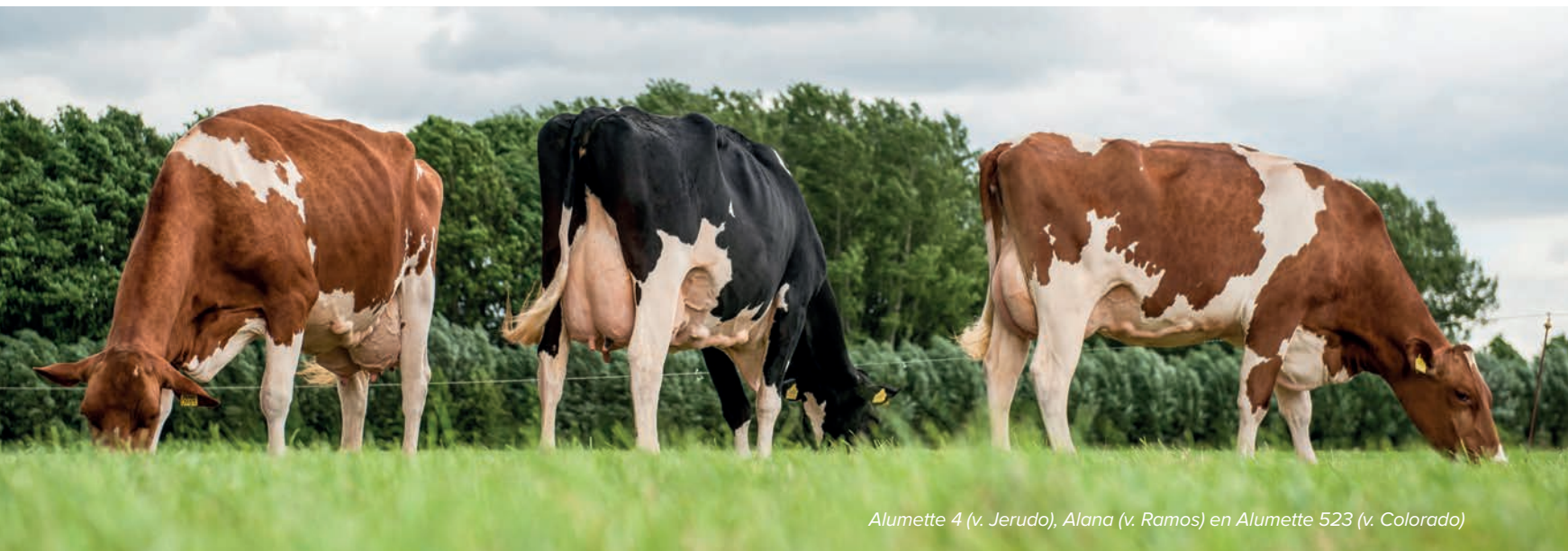
Alumette 4 (v. Jerudo), Alana (v. Ramos) en Alumette 523 (v. Colorado)