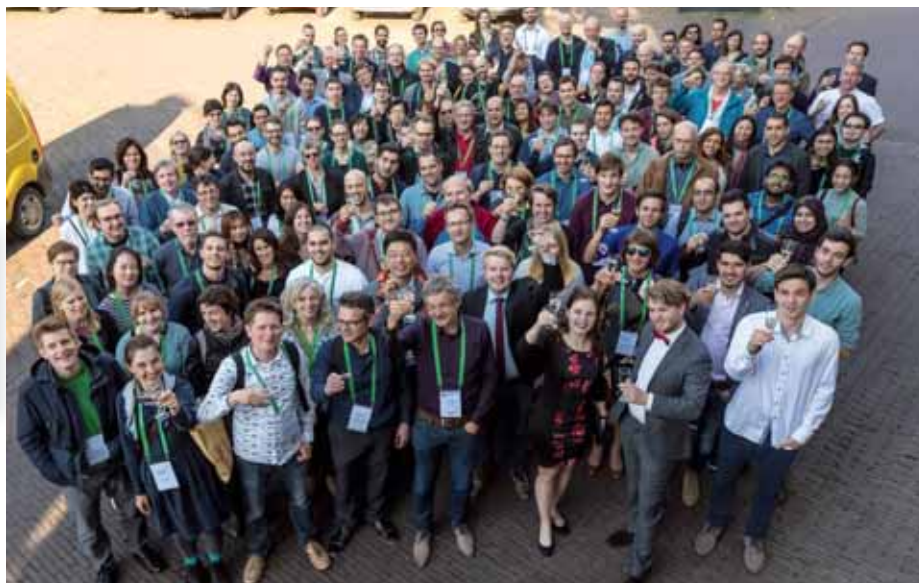
Figuur 2 – Proosten tijdens het galadiner.

Er waren 218 deelnemers. De conferentie telde 9 workshops, bijna 70 presentaties en elke ochtend een keynote voordracht. Er was een postertentoonstelling waarbij zowel een professionele jury als het publiek hun favoriet kozen. Verder vond een algemene ledenvergadering plaats en werden er prijzen toegekend voor de beste papers en posters. Daarnaast was er een sociaal programma met een ontvangst door de burgemeester, receptie door de sponsor, een vroege vogelexcursie, een 5 kilometer-loop, een fietstocht van 20 kilometer en een galadiner met aperitief. Daaraan deden zo'n 150 conferentiebezoekers mee.