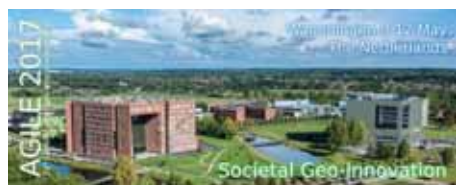
Figuur 1 – Uitnodiging 20e AGILE-conferentie.

In Wageningen werd in mei van dit jaar de 20e editie van de AGILE-conferentie gehouden. Een vierdaags gebeuren over allerlei aspecten van omgang met geo-informatie. Locatie: de campus van Wageningen University & Research.