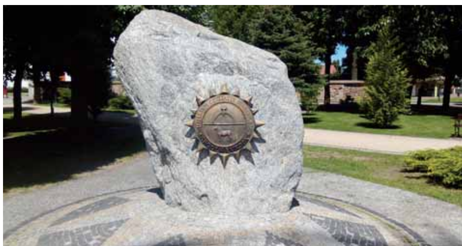
Het Poolse Middelpunt van Europa.

De Poolse claim op het midden ligt in Suchowola, in het noordoosten van Polen. Het door de IGN berekende geografische middelpunt van de Europese Unie ligt in Duitsland. Bij de toetreding van Roemenië en Bulgarije in 2007 is het 180 kilometer naar het oosten verschoven van Kleinmaischeid naar Gelnhausen (bij