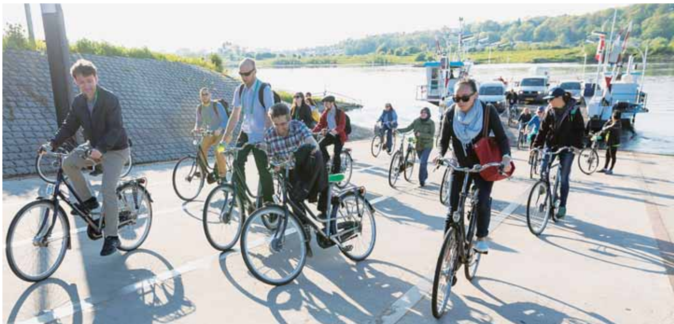
Figuur 8 - De Nederlandse hellingen leverden nauwelijks problemen op.