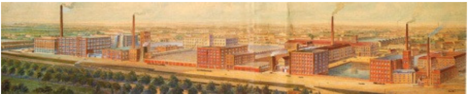
Afb.6. Het Van Heekcomplex in de glorie dagen.

Willem Wilmink (1936-2003) schreef in 1986: Textielstad