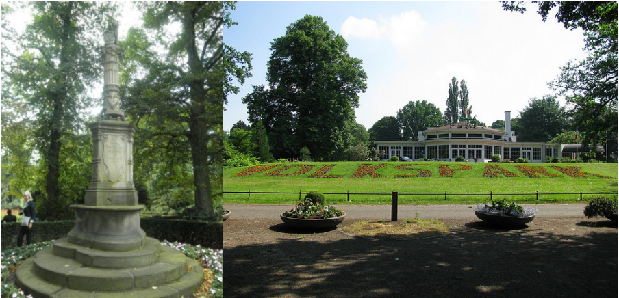
Afb.2. De gedenknaald en Afb.3. Het parkgebouw.