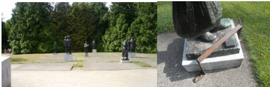
Afb.4 en 5. De beelden van Mari Andriessen, voorzien van elektronische beveiliging en een stalen band.

Sinds 1888 heeft het Volkspark het recht van de kermis, twee keer per jaar (met Pasen en in de herfst), waarvan de opbrengst nog steeds de kosten van het onderhoud van het park dekt. Omdat kermisattracties tegenwoordig steeds omvangrijker en zwaarder zijn is de bestrating in het park daarvoor aangepast. In het park bevindt zich sinds 4 mei 1953 ook het oorlogsmonument van Mari Andriessen. 3 Het blijkt helaas nodig deze beelden te bewaken.