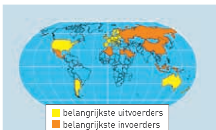
Figuur 1 De wereldmarkt van zuivelproducten

zich schrap zetten voor het handelsakkoord dat met de EU heeft afgesloten, CETA genaamd. De Canadese zuivelsector is beducht voor de invoer van Europese kaas die in het akkoord is voorzien. In Azië spant India de kroon met een verwachte stijging in 2017 van 3,9% of 6,3 miljoen ton. Dat zou de Indiase melkproductie op 166,6 miljoen ton brengen. Deze productie is vergelijkbaar met de EU-productie. India wordt een zuivelland om naar uit te kijken. Echter, ook het verbruik zit er in de lift. Die duidelijkheid kan niet van China worden gezegd, waar de melkproductie wellicht voor het tweede jaar op rij zal dalen als gevolg van te lage prijzen wat dan weer de invoer ten goede komt. De Chinese overheid doet er nu alles aan om ook de kosten voor de