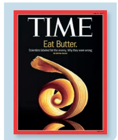
De cover van Time van 23 juni 2014 zette boter in de kijker met de tekst: "Eat butter. Wetenschappers zagen vet als vijand. Zij waren verkeerd."

aan de Griekse yoghurt, en room zitten in de lift wat ook de prijs van het botervet ten goede komt. In een aantal groeilanden in de wereld neemt bovendien met de welvaart ook het verbruik van onder meer patisserie toe. De melkprijs wordt niet bepaald door botervet alleen. Naast het botervet is er het melkeiwit of magere melkpoeder. Melkpoederprijzen staan zeer laag en flirten in de EU met het Europese interventieniveau (figuur 2). Dat is mede een