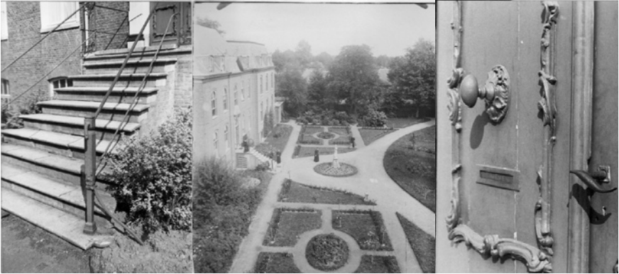
Neo-barokke parterre, centraal gelegen voor het Klooster Bijsterveld. Begin 20ste eeuw.

een breviertuin. Heel uniek voor een kloostertuin was op Bijsterveld een karakteristieke neobarokke siertuin langs de voorgevel van het huis, die op een foto uit 1918 is te onderscheiden.