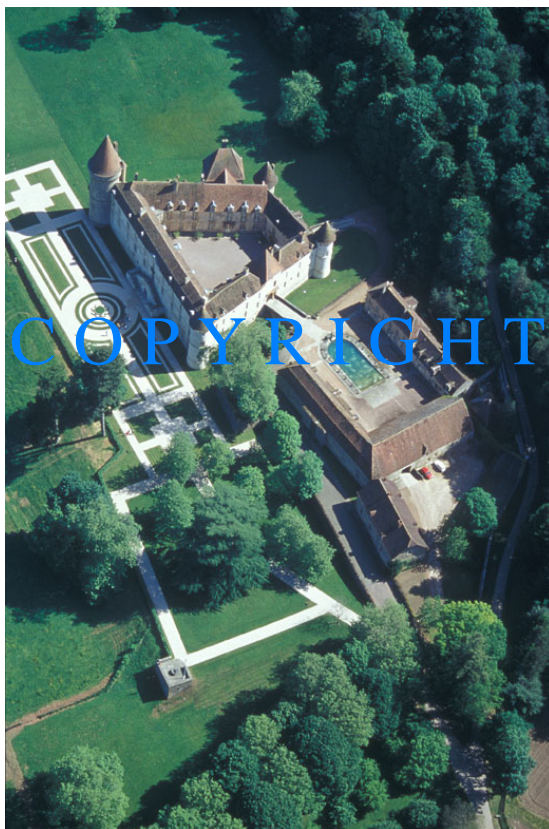
afb.1:Chateau Bazoches, ten zuiden van Vezelay, Bourgogne

Na deze kennismaking met Bazoches kreeg ik vorig jaar een foto van de kloostertuin van Klooster Bijsterveld (Oirschot) uit 1918 onder ogen. Klooster Bijsterveld is in 1903 gesticht door Franse gevluchte Monfortanen uit Saint-Laurent-sur Sèvre (ten zuiden van Nantes in de Vendée). Kasteel Oud-Bijsterveld is van middeleeuwse oorsprong, maar in 1772 opnieuw opgebouwd door de familie Sweerts de Landas. In de negentiende eeuw heeft het gebouw twee vleugels gekregen en later hebben de Monfortanen het huis verder uitgebreid en een kapel gebouwd. De kloostertuin is zoals vele kloostertuinen te beschouwen als enerzijds een boerenbedrijf en anderzijds een tuin met religieuze onderdelen, zoals een Mariagrot en