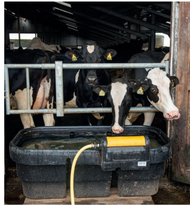
Extra watervoorziening verhoogde de productie