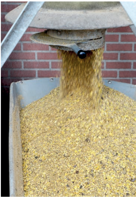
Het krachtvoer is al zes jaar hetzelfde