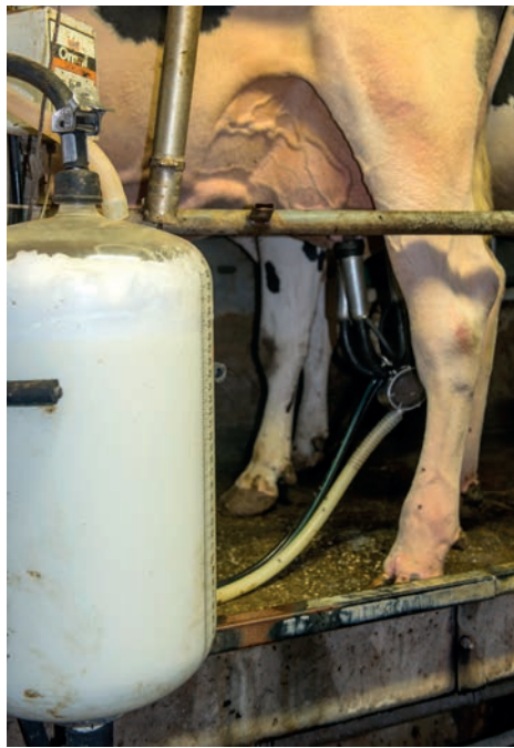
Veel liters melk is het streven