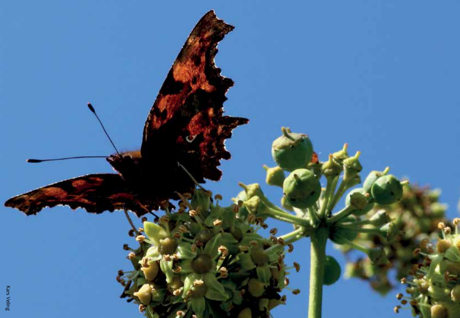
Gehakkelde aurelia op klimop.

goede nectar. Deze heester kan wel 3 meter hoog worden. Snoeien doe je het best direct na de bloei, zodat er het volgende jaar weer bloemen verschijnen. Voor alle heesters geldt dat ze de meeste vlinders lokken, als ze op een zonnige en windstille plek staan.