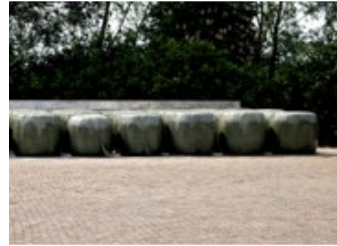
De balen worden voorzien van een snedenummer en een letter van de perceelsnaam.