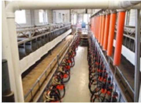
De melkinstallatie is tweedehands. Later is er aan één kant automatische afname ingezet.