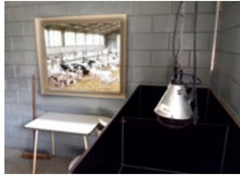
De biestkamer biedt zicht op de dieren. Hij is voorzien van hokjes waar de lammeren een dag of twee in vertoeven.