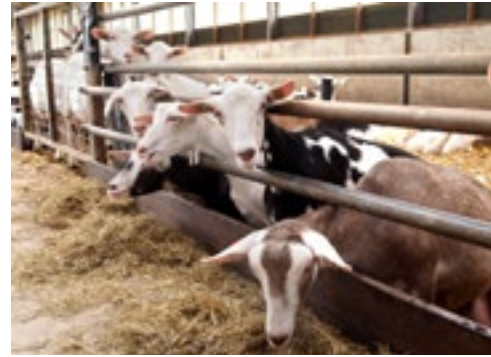
De geiten zijn niet alleen Wit. De zoons Guichelaar geven de dieren met een kleurtje een naam.