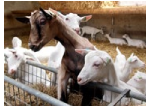
De lammeren zijn gehuisvest in een lichte, ruime stal.