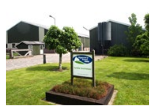
Het erf straalt de rust en reinheid van de ondernemers al uit.