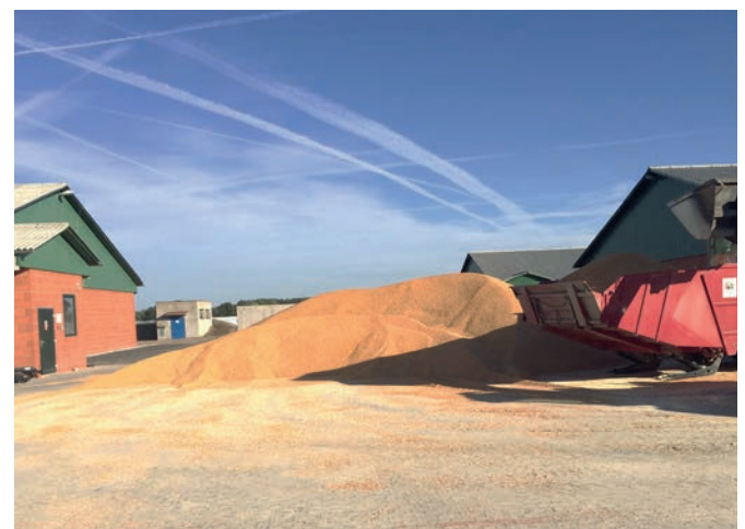
CCM verwerking op het vleesvarkensbedrijf.