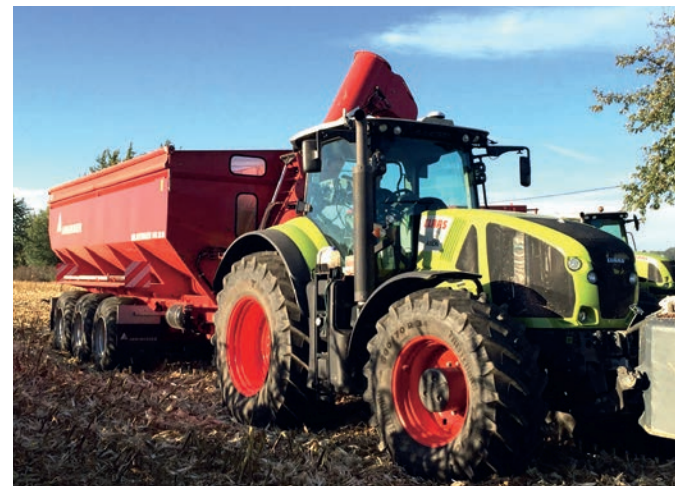
Agro Jacco Bohemia verbouwt eigen voer.