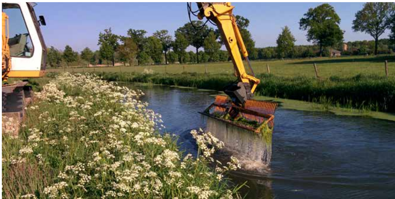
Het maaien van sterrekroos