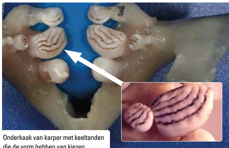
Onderkaak van karper met keeltanden die de vorm hebben van kiezen.

Deze vis trekt tijdens het regenseizoen vanuit rivieren overstromingsvlaktes in waarbij actief wordt gevoerageerd op fruit van verschillende boomsoorten. Daarbij is deze bijna een meter lange vissoort in staat enorme hoeveelheden vruchten te consumeren. Deze zaden blijven kiemkrachtig, sterker nog, bij veel soorten ontkiemen de uitgepoepte zaden juist beter wanneer ze door vissen zijn gegeten. Het kan wel drie dagen duren voordat alle zaden zijn uitgepoept. In die periode hebben de vissen afstanden tot meer dan drie kilometer afgelegd. Zwarte Pacu's zijn daardoor, net als diverse andere vissoorten, effectieve zaadverspreiders.