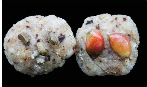
Deegbolletjes met zaden van aarvederkruid (links) en drijvend fonteinkruid (rechts)

Voor het onderzoek zijn van elke soort 100 gekweekte, jonge dieren gebruikt, verdeeld over twintig aquaria van 140 liter met in elk aquarium 10 vissen. Het water van elk aquarium werd via een afvoerpijp, met daarin een fijnmazige zeef, afgevoerd. Hierin werden faeces en zaden opgevangen.