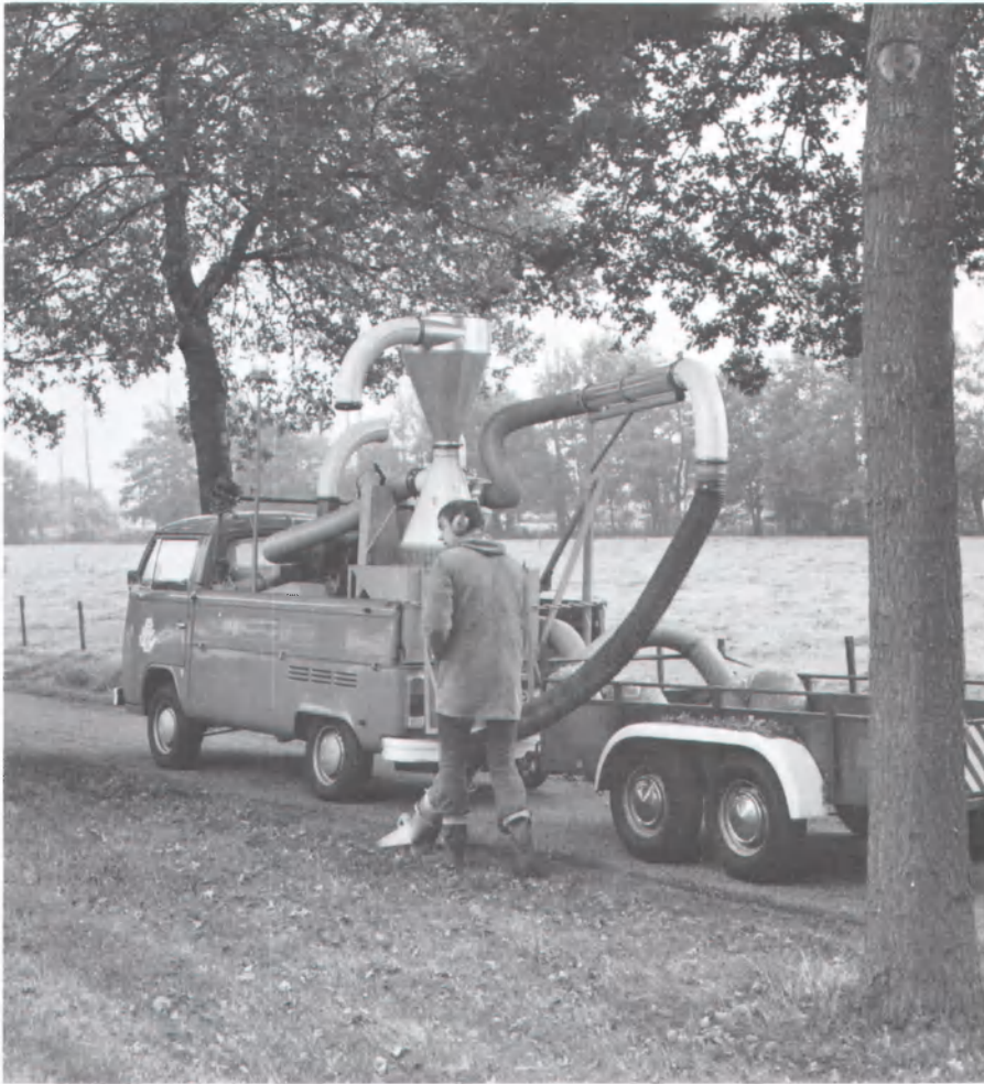
De zaadoogstmachine The seed harvester

verzamelplaats moest plaatsvinden en dat een zekere nareiniging en eindcontrole buiten die verzamelplaats altijd noodzakelijk zouden blijven. Om een indruk te krijgen over hun bruikbaarheid is een drietal in de handel zijnde zuigmachines nader onderzocht. Al snel bleek dat de zuigcapaciteit bij een redelijk vermogen (25-20 kW) voldoende was. Bij twee machines kwam echter teveel breuk voor van de eikels omdat het materiaal door de ventilator werd geleid. Bij de derde machine (Fa. Kongskilde) trad dit probleem niet op. Dit systeem scheidt via een cycloon de eikels en ander materiaal af voordat de ventilator wordt bereikt. Via de sluis wordt dit materiaal dan weer buiten de ventilator om in de perslucht van diezelfde ventilator gebracht. Op die manier wordt de perslucht voor het verdere transport benut. De keus werd toen gemaakt voor laatstgenoemde machine. Het tweede belangrijke punt was de reiniging. Voor het oplossen van dit probleem is gebruik gemaakt van een voorreiniger (cycloon met aparte afzuiging), zoals deze ook door de Fa. Kongskilde op de markt wordt gebracht.