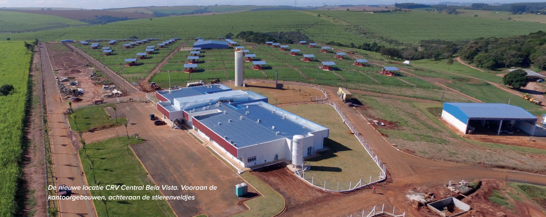
De nieuwe locatie CRV Central Bela Vista. Vooraan de kantoorgebouwen, achteraan de stierenveldjes