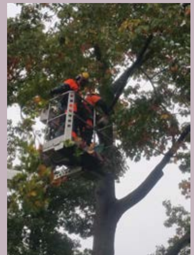
Foto 4 t/m 9 Veiligheid wordt in de basis geborgd door reguliere beheermaatregelen.