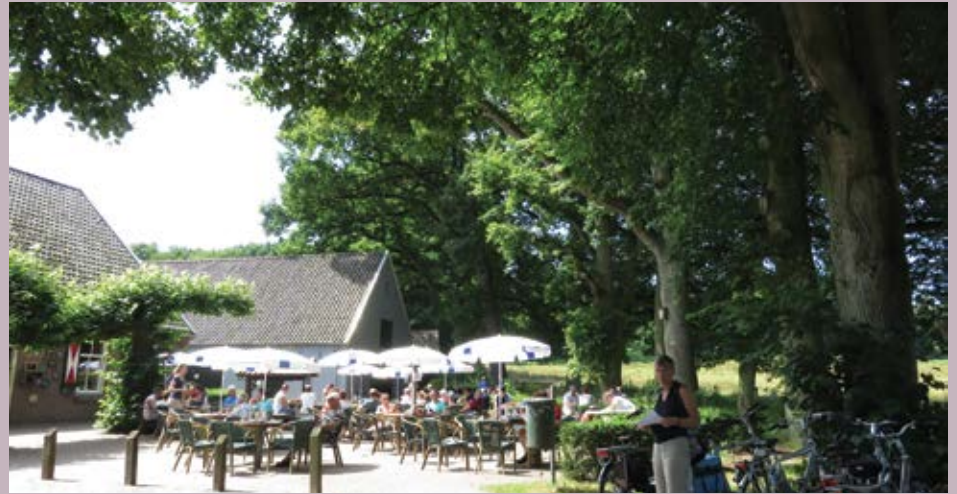
Foto 1 en 2 Bepaalde situaties brengen een hoger risico met zich mee.