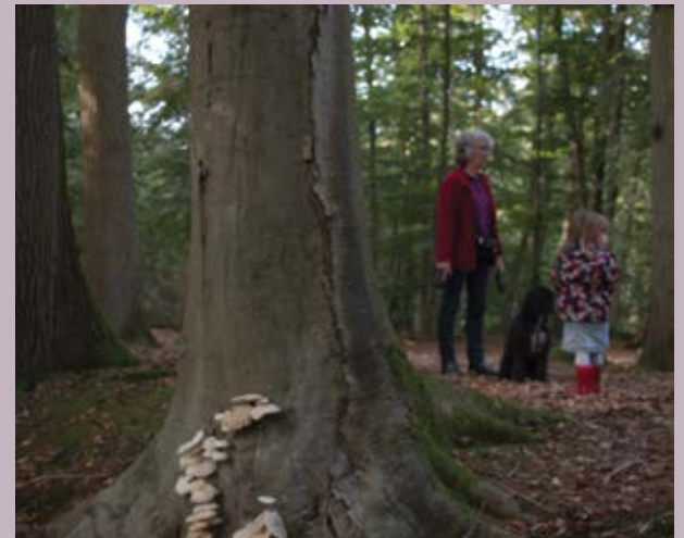
Foto 3 en 4 Bomen met gebreken zijn aanwezig in bos- en natuurgebieden.

maatregelen om te voorkomen dat een ‘derde’ schade lijdt, te beoordelen: