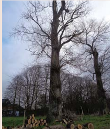
Foto 9 Boom nr. 422