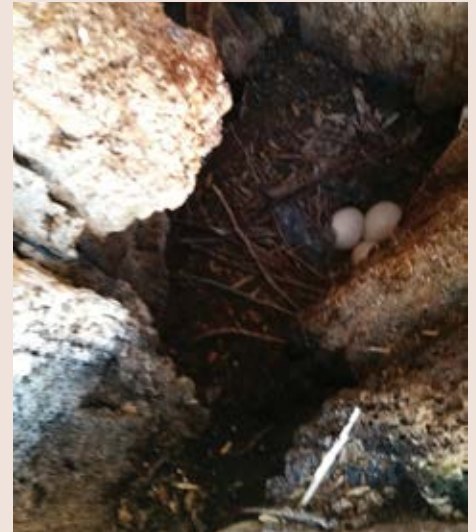
Foto 10 Vogelnest