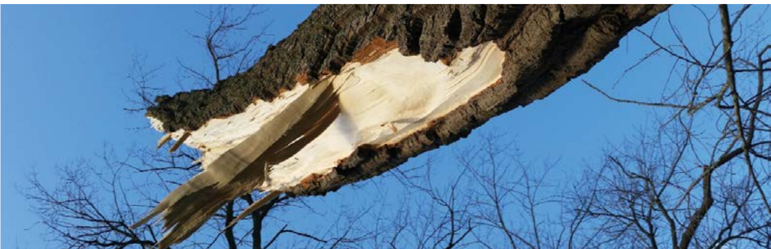
Foto 7 Groot breukvlak

ving van de boomhoogte door te kandelaren de enige veilige manier om de bomen levend te bewaren. Om verschillende redenen bleek het laten uitbreken van de takken door middel van fracture pruning hier de aangewezen methode, niet in het minst omwille van de gewenste natuurbeleving in het natuurreserveaat. Daarnaast doet kandelaren nog te vaak denken aan wanpraktijken om kerngezonde en oerstevige bomen kleiner te maken omdat ze voor bladoverlast en schaduw zorgen. Om het onderscheid te maken tussen dit smakeloos mutileren van bomen en een vakkundige begeleiding naar een veterane fase blijkt fracture pruning bijzonder geschikt. Dit is als argument niet onbelangrijk in de publieke ruimte, omdat het een voorbeeld stelt voor hoe mensen privé met hun bomen omgaan. Het doel van de uit te voeren reducties of het kandelaren was in de eerste plaats om de boom (op een veilige manier) in leven te houden. Door een groot breukvlak te creëren door middel van fracture pruning , heeft de boom een veel grotere blootliggende cambiale zone dan bij een vlakke snede. Op de grote wonde kan de tak massaal opnieuw uitlopen, wat de overlevingskansen vergroot. Bovendien trekt een kartelige breuk met holten en spleten een hoop macro- en micro-organismen aan. Vlakke wonden slagen hier minder goed in.