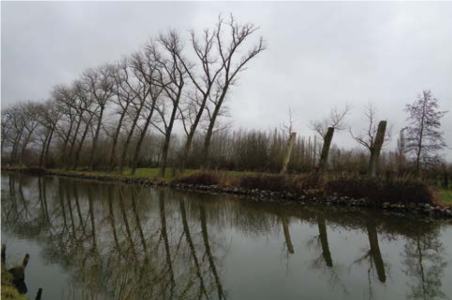
Foto 6 Ecologische vellingen uit 2011