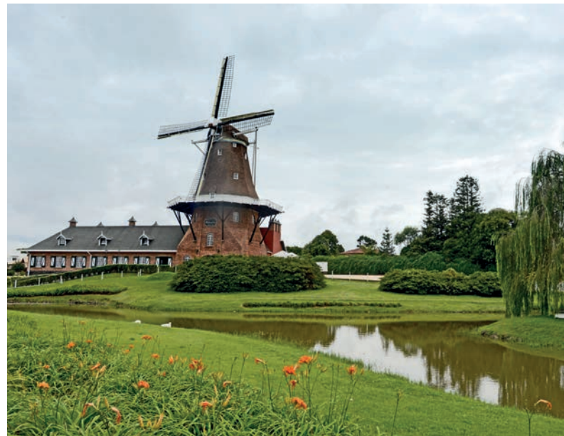
De molen 'De Immigrant' staat in het centrum van Castrolanda

proefvelden aan om te kijken wat wel en wat niet werkte. Boeren in Brazilië was wel wat anders dan boeren in Nederland.' Een goede samenwerking binnen een coöperatie was niet altijd vanzelfsprekend. 'Natuurlijk zijn er door de jaren heen stevige discussies gevoerd door de leden over de koers van de coöperatie.' Borg formuleert zijn antwoorden zorgvuldig, alsof hij niet te veel gevoeligheden wil oprakelen. 'Vooral de beginjaren waren lastig. Ook de jaren negentig met een inflatie van 80 procent per maand en een rentepercentage van 40 procent heeft de coöperatie veel geld gekost. Maar onze leden zagen ook dat je samen sterker staat dan alleen en dat de coöperatie zekerheid biedt. Maar het echte succes van deze kolonie is te danken aan de drie-eenheid coöperatie, school en kerk. Dat heeft ons op alle terreinen verbonden en tot op de dag van vandaag bijeengehouden.'