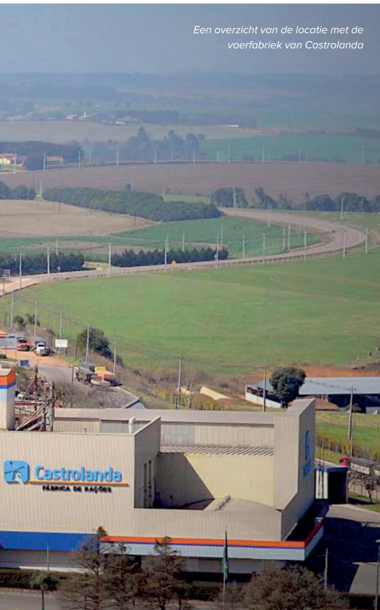
Een overzicht van de locatie met de voerfabriek van Castrolanda