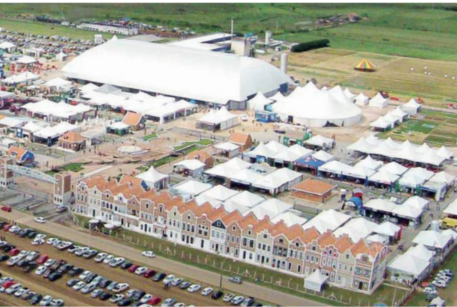
Hollandse gevelwoningen op het beursterrein van Agroleite