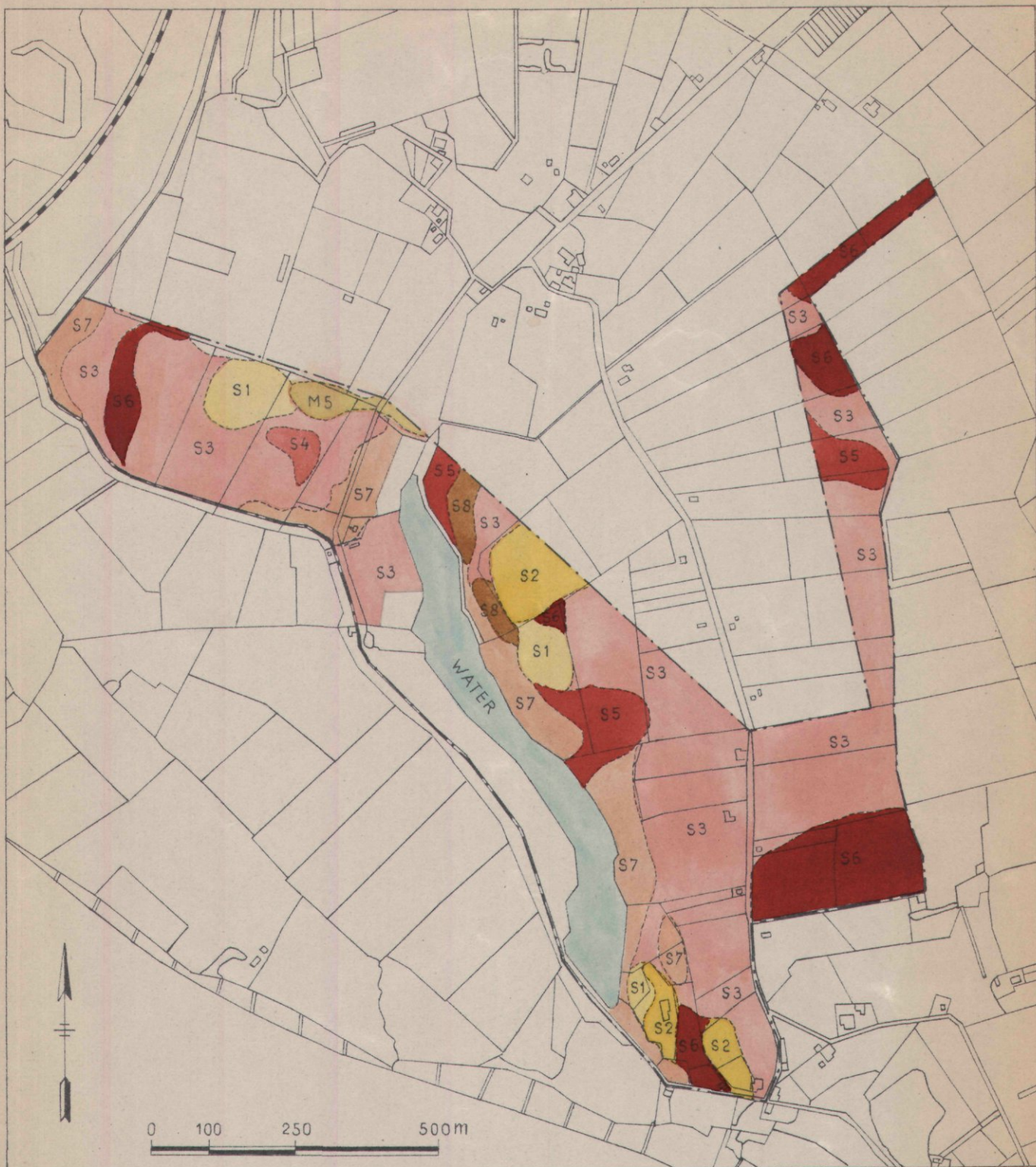
AANVULLEND BODEMKAARTJE SCHELLE (GEM. ZWOLLE)