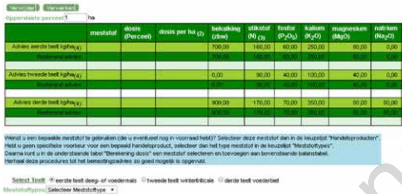
Figuur 1 Overzicht van het startscherm bij openen van de toepassing

ontledingsverslag. Bovenaan het scherm kan je – indien gewenst – de oppervlakte van je perceel aanpassen. Helemaal onderaan kan je aangeven voor welke teelt je het advies wenst om te rekenen en welke meststoffen je hiervoor wil gebruiken. Je kan kiezen voor minerale kalk, minerale meststoffen of organische meststoffen. Het is belangrijk te beseffen dat de organische meststoffen in de lijst gemiddelde waarden bevatten. De variatie tussen verschillende meststalen is vaak groot, zelfs tussen stalen van dezelfde mestsoort. Daarom is het altijd interessant om gebruik te maken van cijfers die specifiek zijn voor je bedrijf. Om landbouwers die een meststaalname hebben laten uitvoeren deze mogelijkheid te bieden, is de optie 'eigen meststoffen' opgenomen in de keuzelijst. Hier kan de landbouwer gebruik maken van al zijn uitgevoerde mestanalyses. Voor elk meststofftype is een keuzelijst van meststoffen beschikbaar (zie onderaan in figuur 2). Naast de bemestingswaarde bevat deze lijst ook de hoeveel-