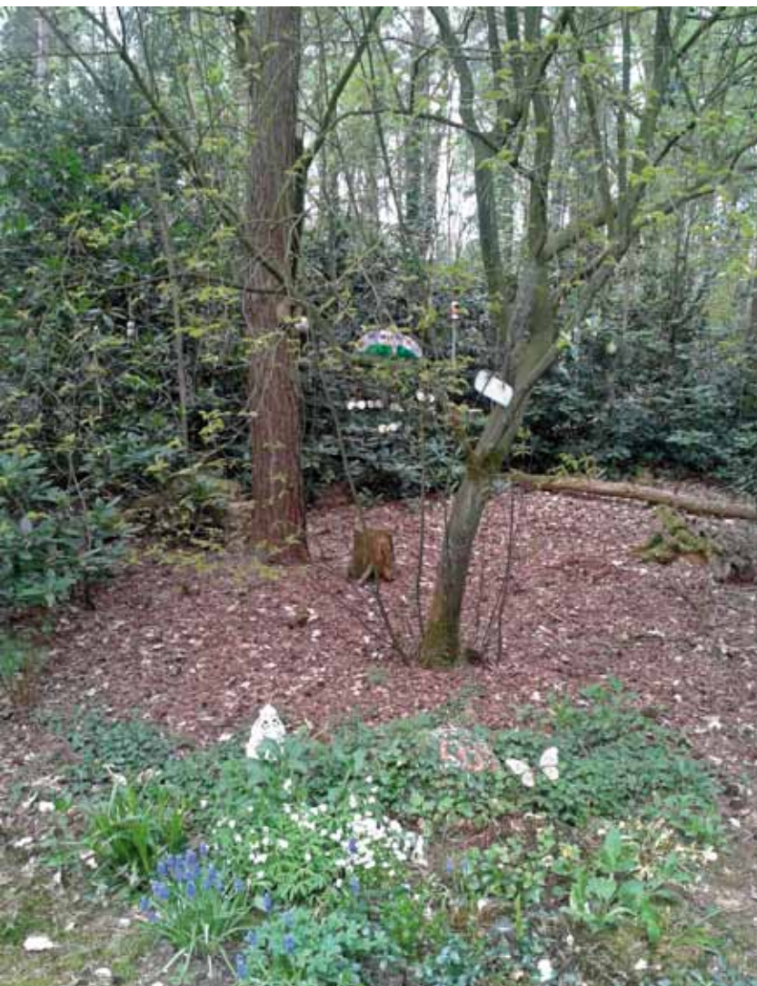
Graf op natuurbegraafplaats waar meer wordt toegestaan.

In verband met de effecten op de natuur wordt bij de bestemming 'bos of natuur' met een dubbelbestemming of functieaanduiding 'natuurbegraafplaats' voorwaarden gesteld aan het aantal graven per hectare. Dat varieerde in 2014 van 100