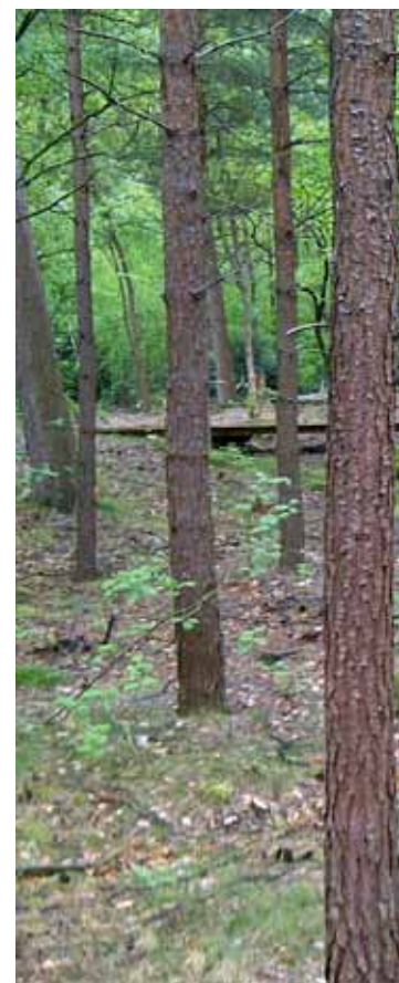
Omvorming van landbouwgrond naar natuurbegraafplaats