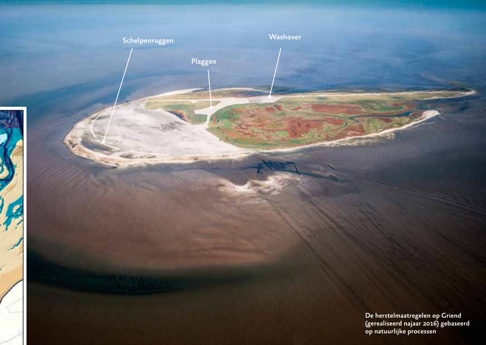
De herstelmaatregelen op Griend (gerealiseerd najaar 2016) gebaseerd op natuurlijke processen