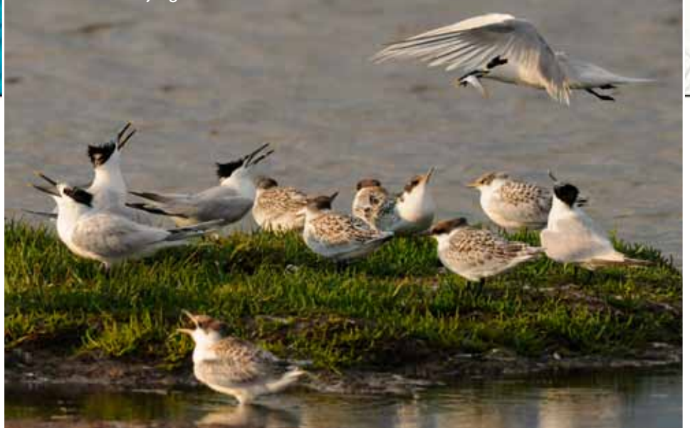
Grote sterns met jongen