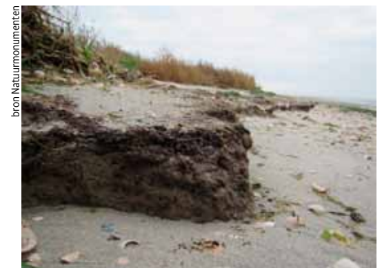
Onder de stormvloedwadij komt de klei tevoorschijn, Griend 2016

Griend ligt midden op een wadplaat tegenover een zeegat en op de splitsing van een grote geul. Dat is de plaats waar tijdens stormvloed schelpenmateriaal en een vloedmerk wordt gedeutoneerd, die een banaanvormige wal vormen. Als de schoorwal met planten begroeid raakt en voldoende lang in tact blijft, ontstaat in het rustige deel achter de wal een kwelder. De vegetatie van die beschutte kwelder vangt klei in, wordt langzaam hoger en breidt zich uit richting zuidoosten met pioniersvegetatie (zoals zeekraal). Deze processen verzekeren de aangroei van het eiland. Het afbrekende proces vindt plaats aan de westzijde van de schoorwal als gevolg van golfaanvallen. De schoorwal schuift daardoor over de kwelder en op een gegeven moment komt de klei van de kwelder onder de schoorwal tevoorschijn. Naast de van oorsprong aanwezige schelpen en het aanspoelsel zorgt deze stevige kleilaag voor vertraging van het afbraakproces aan de noordwestkant. Hoe langer deze vertraging optreedt, hoe meer tijd er is voor opbouw van klei op de kwelder en hoe langzamer de afbraak uiteindelijk gaat. Voor 1930 droeg ook de afzetting van (langzaam afbrekend) groot zeegras waarschijnlijk bij aan de schoorwal, er was een soort natuurlijke wierdijk aanwezig. Na 1930 verdween niet alleen het zeegras, maar werd ook de golfwerking sterker, zodat de afbrekende krachten de overhand kregen.