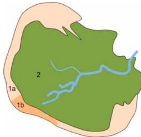
Schematische weergave van een stormvloedwadij eiland in de Waddenzee 1: wal, 2: kwelder