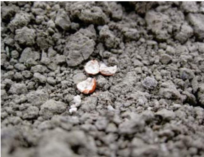
Door muizen opengebroken pil. Tijdig alternatief voer aanbieden beperkt de schade.

Regelmatige controle van het zaaierk is nodig, omdat het zaaibed kan verschillen op het perceel. Belangrijke aandachtspunten zijn zaaidiepte en de werking van de zaaikouters.