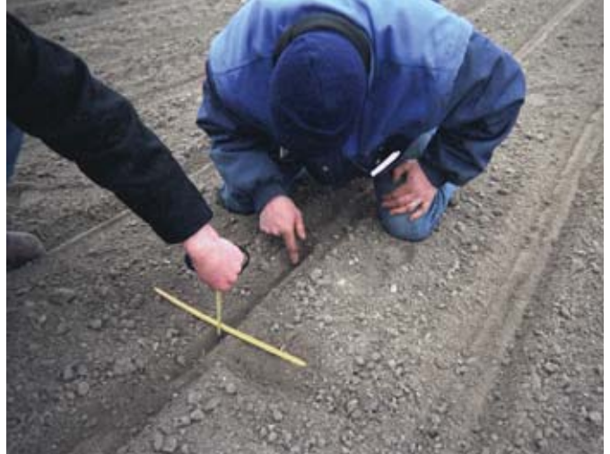
Een regelmatige controle van de zaaidiepte (2-4 cm) en zaaiafstand is nodig voor een uniforme opkomst.

Vanaf 1 maart kan de teler in principe zaaien zodra de grond voldoende opgedroogd is om zonder verdichting het zaaibed te kunnen maken. Hoe vroeger de bieten zijn gezaaid, hoe langer het groeiseizoen en hoe hoger de opbrengst. Elke week eerder zaaien in maart levert ongeveer 250 kg suiker per hectare op. Maar als de vooruitzichten voor de langere termijn zijn dat de maximumtemperaturen onder de twaalf graden blijven, dan is het vanwege de grotere kans op schietervorming beter om nog even te wachten tot na 10 maart. Ook rhizoctoniaresistente