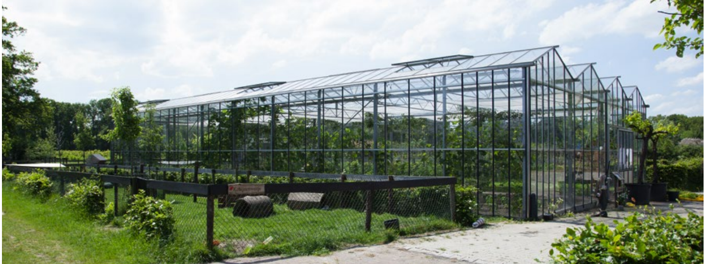
Eierlikeur 'Paradijsroom' en kassencomplex van zorgboerderij Het Paradijs in Barneveld.