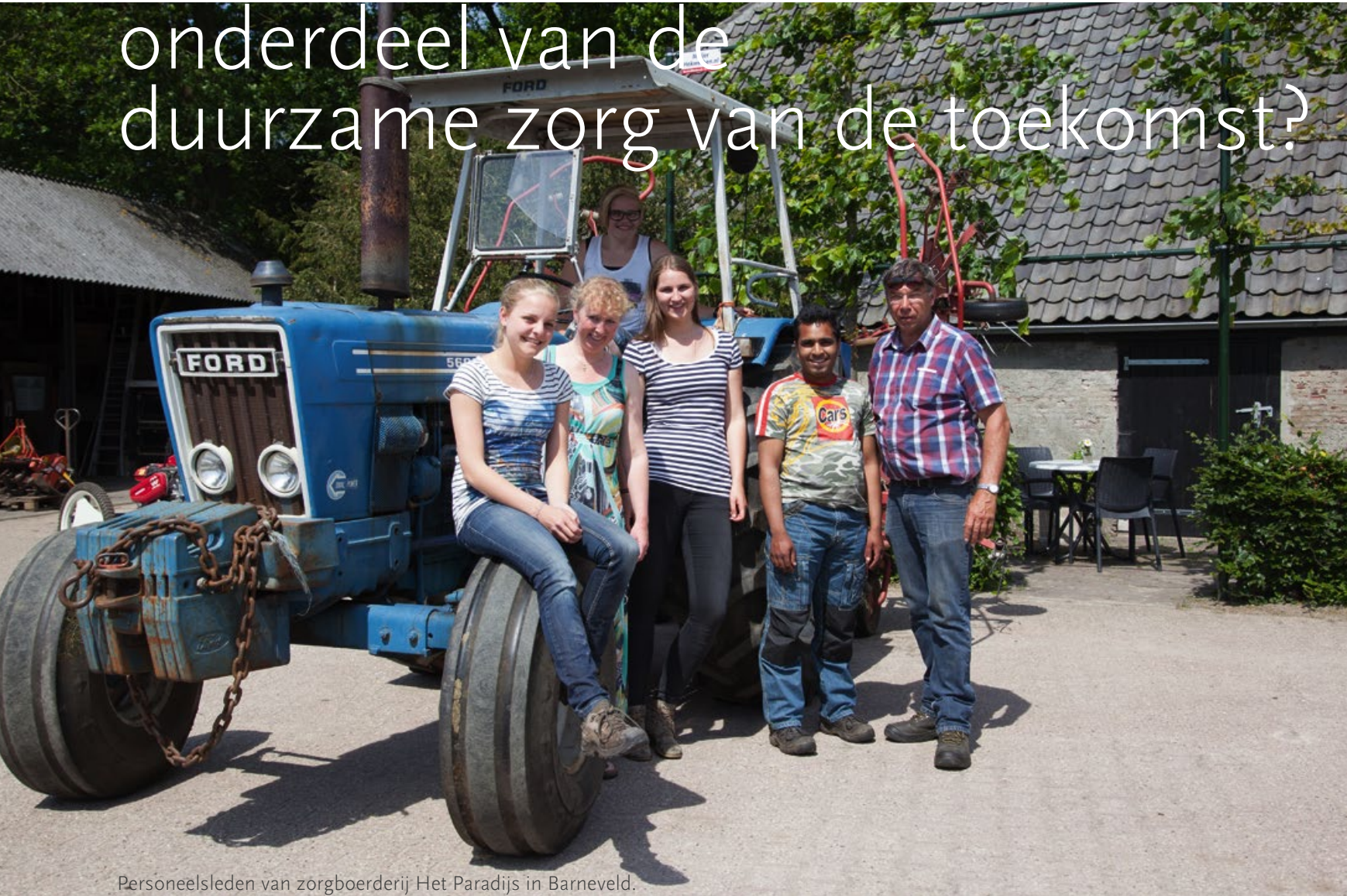
Personeelsleden van zorgboerderij Het Paradijs in Barneveld.

onderdeel van de duurzame zorg van de toekomst?