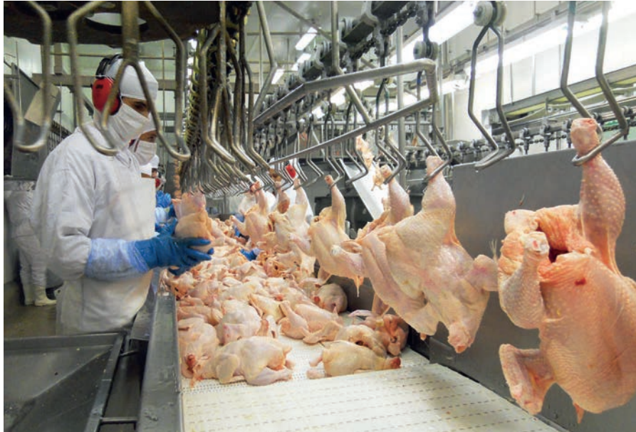
Jaarlijks slacht Brazilië bijna 6 miljard kuikens.

productie en export en menige Nederlandse pluimveehouder zal groen zien van jaloezie bij deze prachtige vooruitzichten. Hoe kan het dat Brazilië de laatste jaren zo fors groeit? Een belangrijk deel van het antwoord ligt in het land zelf. Brazilië heeft een oppervlakte van meer dan 8,5 miljoen vierkante kilometer met veel goedkope landbouwgrond, voldoende neerslag, zeer vruchtbare grond en optimale klimatologische omstandigheden. Het land leent zich bij uitstek voor landbouw. De sector is ook altijd de grootste drager geweest van de Braziliaanse economie. Daarbij komt dat kosten voor voer, grond, huisvesting en arbeid zeer laag zijn. Brazilië heeft dus een ongelooflijk groot kostprijzenvoordeel en teelt ook nog eens zijn eigen veevoer. Daarnaast groeit de economie in Brazilië en daarmee ook de consumptie van dierlijke eiwitten. Kip is het goedkoopste stukje