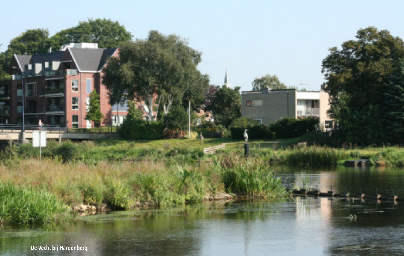
De Vecht bij Hardenberg

de rivier meegevoerd zand weg blies. Op de lager gelegen plaatsen daarachter ontstond hoogveen dat later afgegraven is. Alleen de Lemelerberg is een vreemde eend in de bijt, die is net als de Sallandse Heuvelrug in de ijstijd gevormd door gletsjers. De beleving van het landschap is echter een ander verhaal. Grofweg gezien is er in het landschap een duidelijke relatie met de Vecht op de strook land van een paar honderd meter ten noorden en ten zuiden van de rivier, maar ook daar zijn de dorpen en steden van de Vecht af gericht. Dit is bijvoorbeeld te herkennen aan het gebrek aan terrasjes met recreanten aan de Vecht. De rivier had bij veel lokale mensen een slechte naam. Verder ten noorden of ten zuiden is er geen zichtbare relatie meer met de Vecht. Zo waan je je in Drenthe als je op de brink van Rheeze staat, terwijl die hemelsbreed toch maar 500 meter van de Vecht afligt. De bossen rondom Ommen (noordoever) en Beerze (zuidoever) vormen een blok dat de relatie met de rivier voor de daarachter gelegen agrarische gebieden bemoeilijkt. Dat dit zich vertaalt in een gebrek aan een eenduidige identiteit in het Vechtdal bleek toen in oktober 2016 negen studenten van de opleidingen land- en watermanagement en tuin- en landschapsinrichting zich in dit onderwerp verdiepten. Zij hebben binnen de gemeentegrenzen van Dalfsen, Ommen en Hardenberg onderzoek gedaan naar de gebiedsidentiteit en daarvoor analyses van