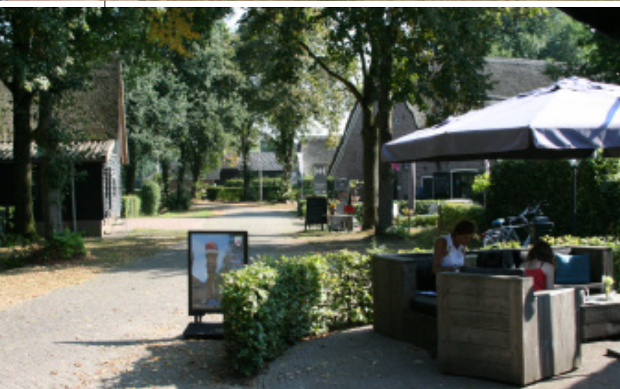
Boven: Pleintje in Ommen met uitzicht op de Vecht. Onder: Je waant je in Drenthe als je op de brink van Rheeze staat.

wel. Bij de Vecht zit er altijd nog een stuk weiland of een hek tussen het fietspad en de Vecht.”