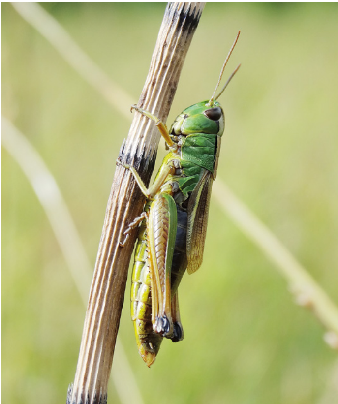
1. Vrouwtje zompsprinkhaan, Chorthippus montanus , in de Hamstermieden, 18.viii.2013. 1. Female Chorthippus montanus in the nature reserve Hamstermieden, 18.viii.2013.