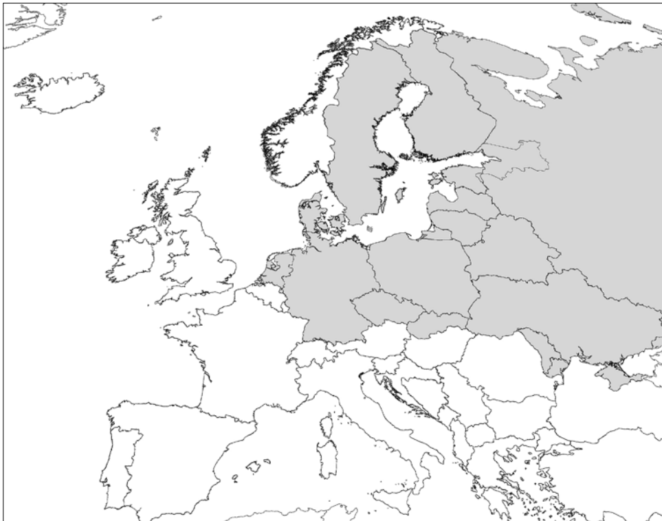
3. Voorkomen van Bembidion ruficolle . Kaartje gebaseerd op in de tekst aangehaalde literatuur. 3. Distribution map of Bembidion ruficolle . Map based on the literature cited in the text.

doordringen. En inderdaad, Hannig & Oellers (2013) melden de soort uit het district Wezel (Noordrijn), waar hij op twee locaties op licht werd gevangen in 2010. In 2011 werd hij wederom in dat gebied verzameld aan de oevers van een tweetal grindgaten. Tevens melden zij de eerste vondst van B. ruficolle uit Westfalen: drie exemplaren op strandjes langs de Lippe (natuurgebied Lippeaue Selm).