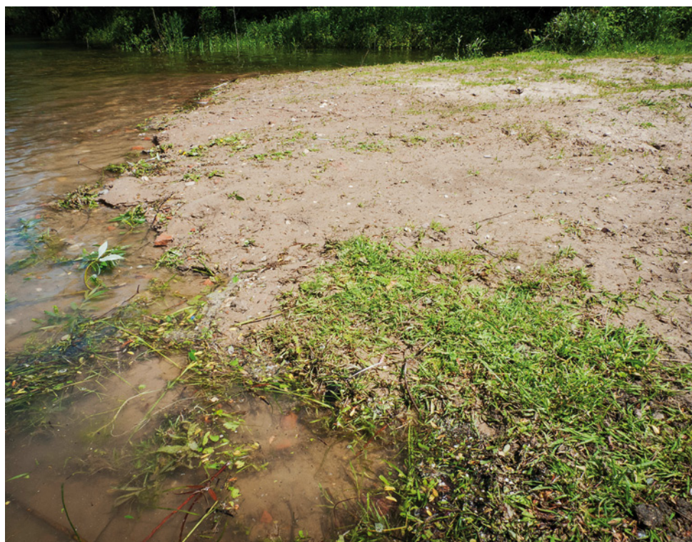
2. Vanglocatie van Bembidion ruficolle in de Millingerwaard. De exemplaren werden verzameld in het droge losse zand, net boven het natte gedeelte van het strandje. 2. Collection location of Bembidion ruficolle in the Millingerwaard. The specimens were collected on the dry sandy area, just above the wet part of the bank.

Müller-Motzfeld (2004) schrijft dat Bembidion ruficolle zich in warme jaren naar ver buiten haar reguliere areaal kan verplaatsen en zo tot in de Nederrijnregio (Noordrijn-Westfalen) kan