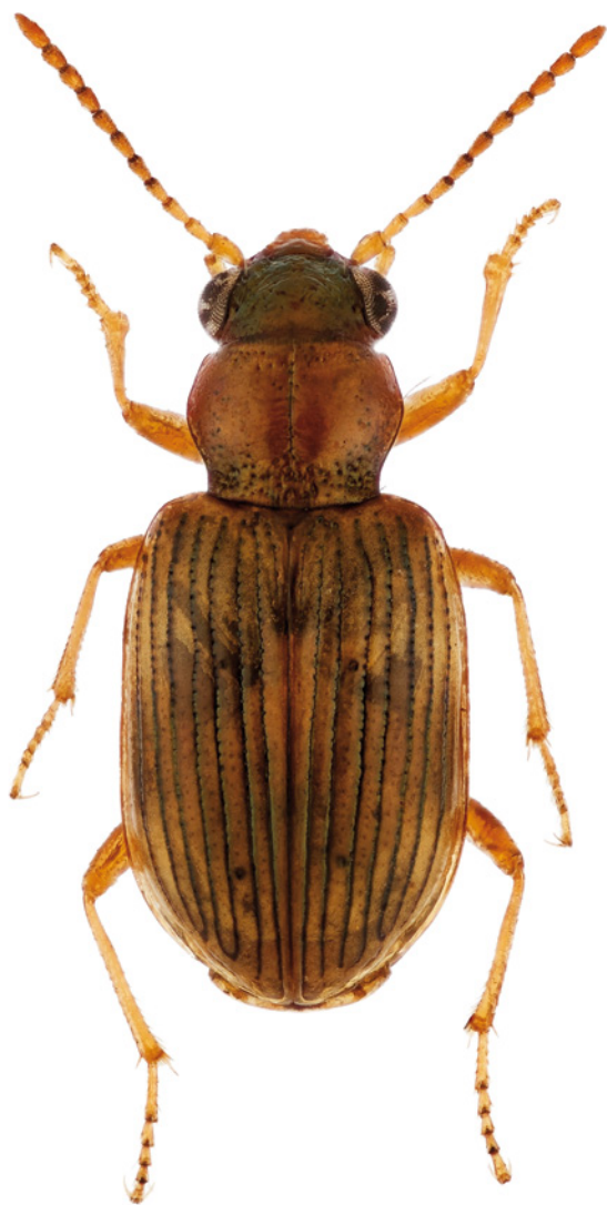
1. Bembidion ruficolle , Millingerwaard, 19.vi.2012. 1. Bembidion ruficolle , Millingerwaard, 19.vi.2012.

aangegeven waarin de soort voorkomt. Om stippenkaarten te kunnen maken moet men natuurlijk beschikken over de eigenlijke waarnemingen zelf en dat is vaak niet het geval. Voor zeldzame en plaatselijk voorkomende soorten als B. ruficollis zal het gepresenteerde verspreidingsgebied extra vertekend zijn.