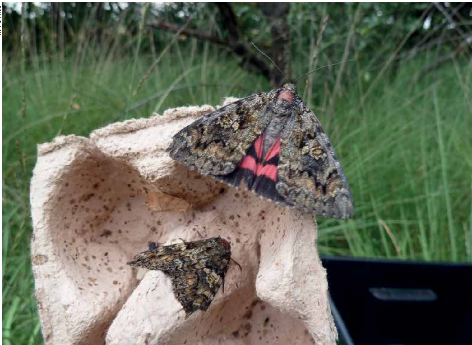
Twee exemplaren van het karmozijnrood weeskind die met dit model val zijn gevangen op 8 augustus 2013.