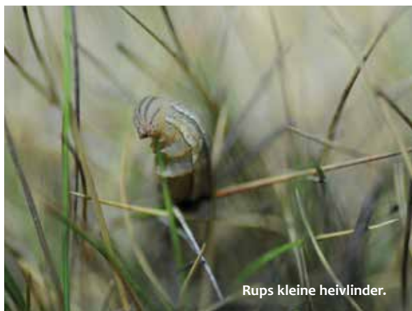
Rups kleine heivlinder.