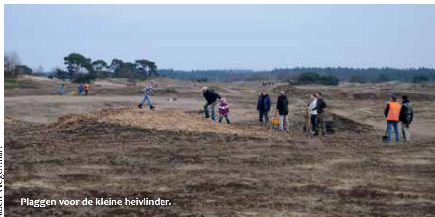
Plaggen voor de kleine heivlinder.