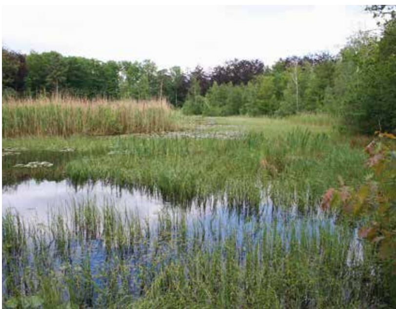
Een ven bij Heeze waar de speerwaterjuffer nog voorkomt. De rijk gestructureerde vegetatie is goed zichtbaar.

Om meer te weten te komen over de ecologie en habitatseisen van de speerwaterjuffer in Nederland heeft De Vlinderstichting in 2001 een uitgebreid onderzoek uitgevoerd (Ketelaar, 2001). Dit leidde tot een goede karakterisering van het leefgebied. Kort samengevat