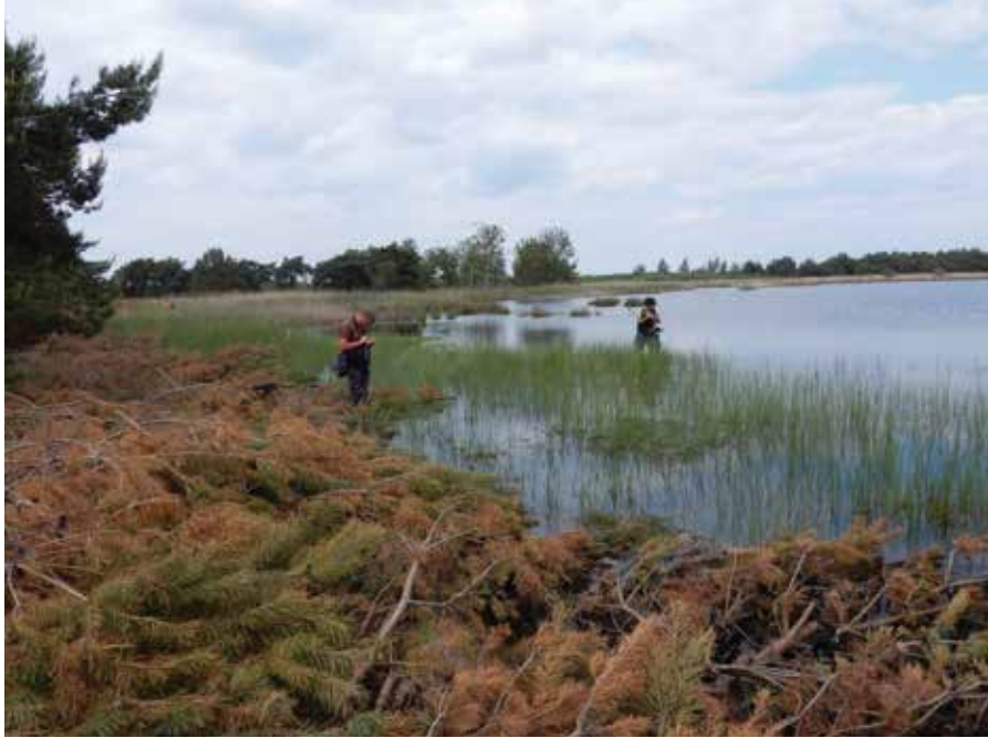
Een van de vennen waar in 2015 vegetatieopnamen zijn gemaakt en watermonsters zijn genomen.