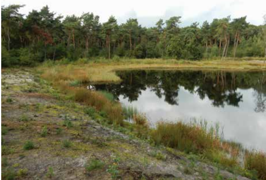
Bij een ven bij Oisterwijk zijn in de winter van 2012-2013 herstelmaatregelen uitgevoerd. De speerwaterjuffer blijkt dit goed overleefd te hebben en hoop is nu gevestigd op uitbreiding naar naburige vennen.