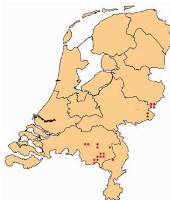
De speerwaterjuffer komt sinds 2000 alleen nog voor in Twente, de Achterhoek en de oostelijke helft van Noord-Brabant.

zijn dat zwakgebufferde, matig voedselrijke vennen en randen van hoogvenen met een rijk gestructureerde verlandingsvegetatie in de oeverzone. Deze vegetatie bestaat meestal uit een combinatie van ondergedoken, drijvende en uit het water stekende planten. Vaak zijn veldjes van snavelzegge of draadzegge en fonteinkruidenten aanwezig. Daarnaast zijn meestal meerdere plantensoorten aanwezig die de invloed van grondwater in het ven indiceren. Verzuring, vermessing en vooral ver-