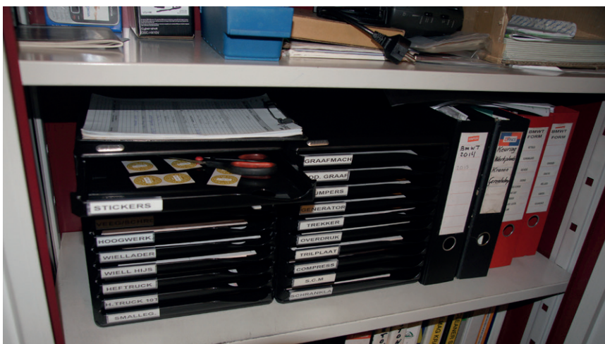
Voor elk type is er een apart keuringsformulier.