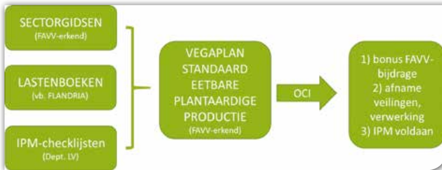
▲ Schematische voorstelling certificeringsproces