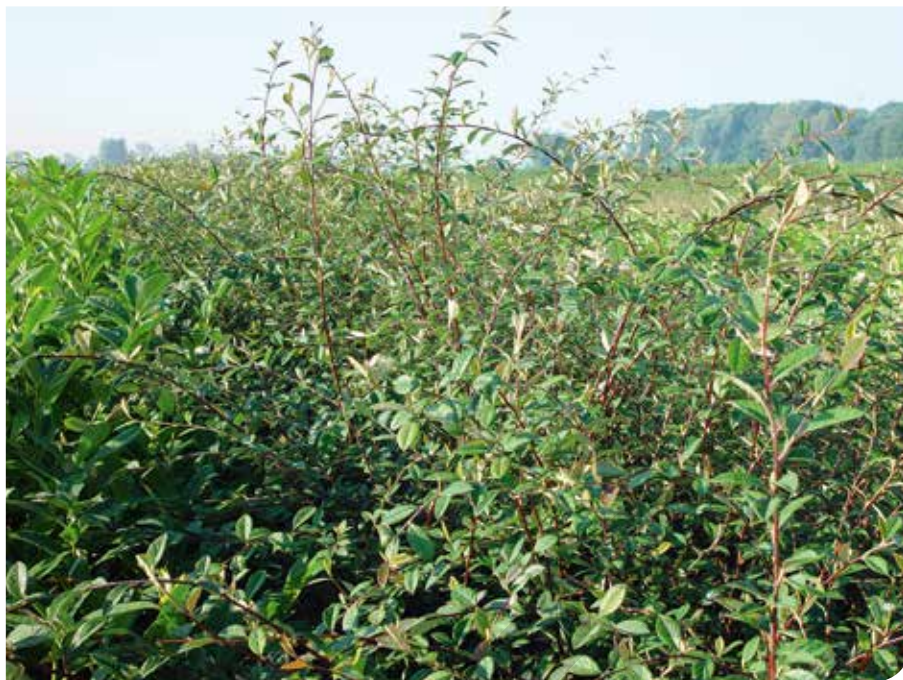
▲ Ligt uw perceel niet in een bufferzone of beantwoordt het niet aan de ZP-eisen, dan is het verboden om bacterievuurwaardplanten te verzenden naar de in onderstaand kader vermelde landen of streken.

Van de 204 aangegeven ZP-percelen (744,14 ha) in 2016 werden er 162 (of