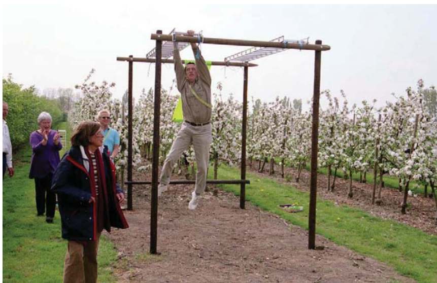
Bezoekers buiten in de boomgaard