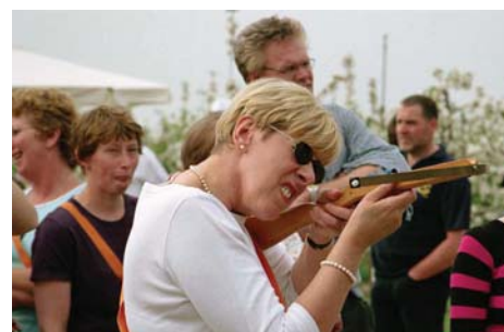
Opperste concentratie