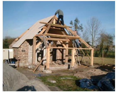
Er wordt hard gewerkt aan het hoenderhok