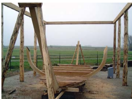
De Wierumer Aek in aanbouw

De PG van Lauwersland heeft voor beide projecten een forse bijdrage gegeven en hoopt daarmee een impuls