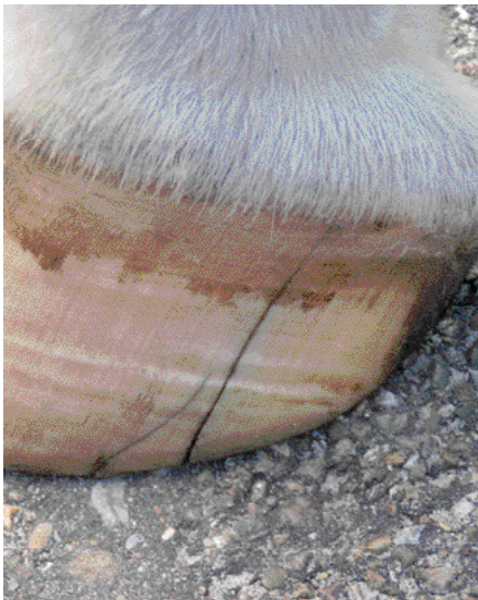
Hoornscheuren zijn op alle bezochte bedrijven aangetoond.

20% van de paarden werden groeiringen aangetroffen (13% recht en 7% divergerend).