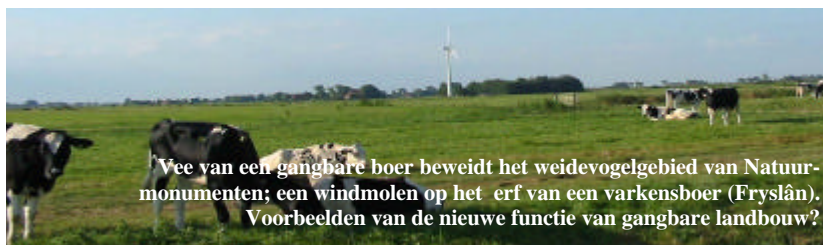
Vee van een gangbare boer beweidt het weidevogelgebied van Natuurmonumenten; een windmolen op het erf van een varkensboer (Fryslân). Voorbeelden van de nieuwe functie van gangbare landbouw?

Het LEADER+ Netwerk / Nationaal Netwerk voor Plattelandsontwikkeling wil de verantwoordelijkheid van bewoners en gebruikers weer centraal stellen in dit debat. De participatieve LEADER methode leent zich uitstekend voor dit soort gebiedsgerichte ontwikkeling van de landbouw in het perspectief van brede plattelandsontwikkeling. NOTEER ALVAST IN UW AGENDA: 27 November 2003. Informatie/opgave: Leadernetwerk bureau te Leusden