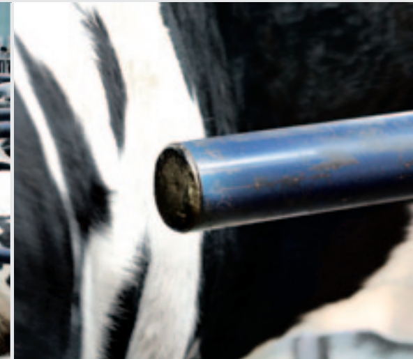
De kunststof buizen worden afgewerkt met een rubberen dop.