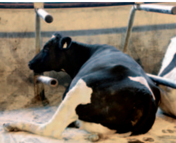
Het is opvallend hoeveel ruimte koeien in de box hebben, zegt melkveehouder Bloo.