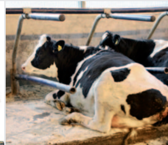
Door de flexibele buizen kunnen koeien gemakkelijk gaan liggen en ook weer gemakkelijk opstaan.