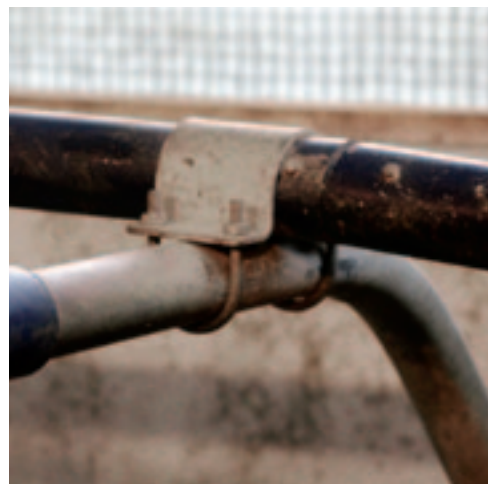
Ook de schoftboom is van kunststof. Op die manier beschadigt ook de nek van de koe niet.