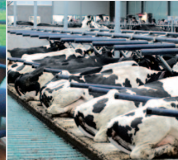
De Agriprom flexibele boxafscheidings zorgen voor veel rust in de stal.