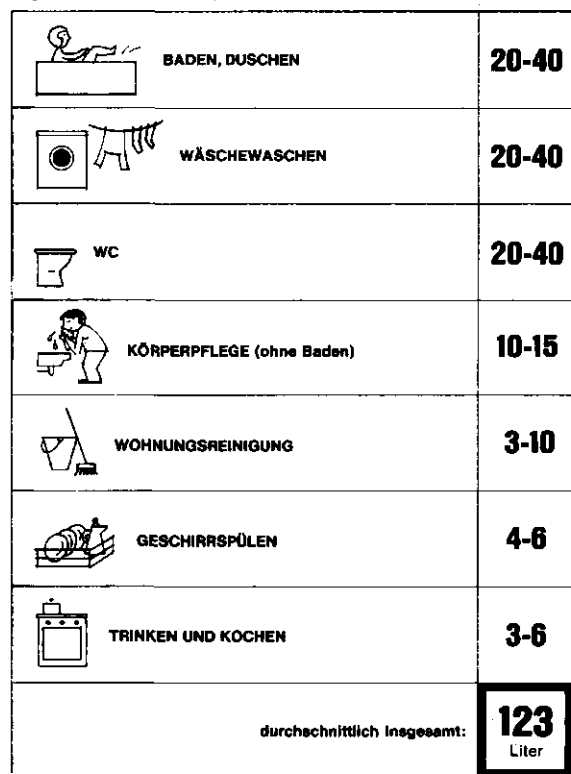
Der tägliche Wasserverbrauch im Haushalt pro Person verteilt sich auf folgende Bereiche (in Litern):