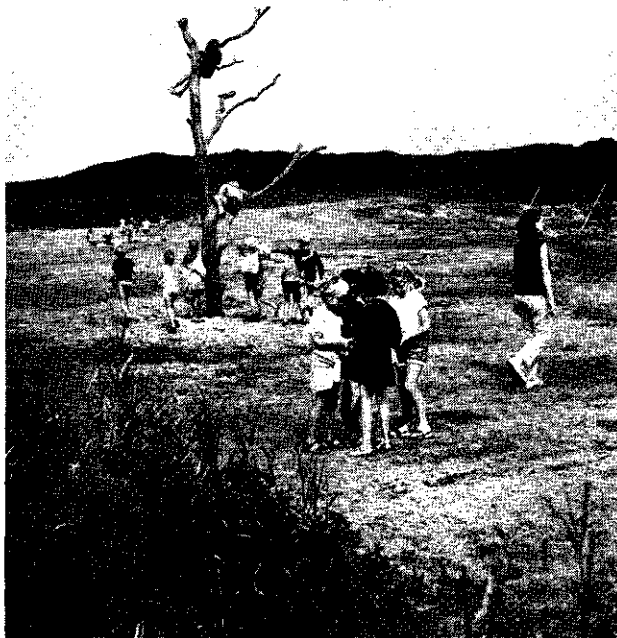
Speelterrein in Wijk aan Zee.

Dit valt nog meer op, wanneer men ook de fauna in dit beleven betreft. Een akker of ook een bos met rechte boomrijen en rechte paden er doorheen, wordt voor de bezoekers plotseling vrije natuur wanneer er grote in het wild levende zoogdieren of vogels op te zien zijn.