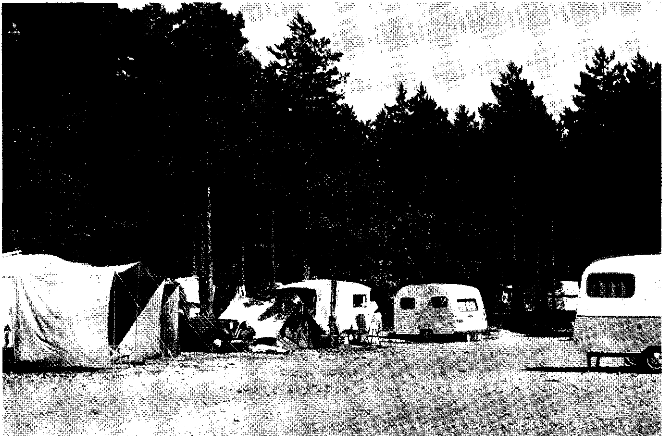
Caravanterrein in kamp Bakkum.

Naast deze massa-recreant komt dan nog voor de individuele recreant. Hij gaat de natuur niet in voor de gezelligheid, maar voor de natuur zelf en de daar heersende rust. Hij valt niet op, wenst ook niet op te vallen en je kunt hem overal verwachten. Vaak weet hij veel af van planten of dieren, vooral vogels of insecten, vaak ook is hij verzamelaar van de een of andere groep van planten of dieren. Sommigen verzamelen vogeleieren. Het merendeel echter zoekt eenvoudig de rust van de natuur, waar men steeds weer wat anders te zien krijgt of kan ontdekken. Het verschijnen van in het