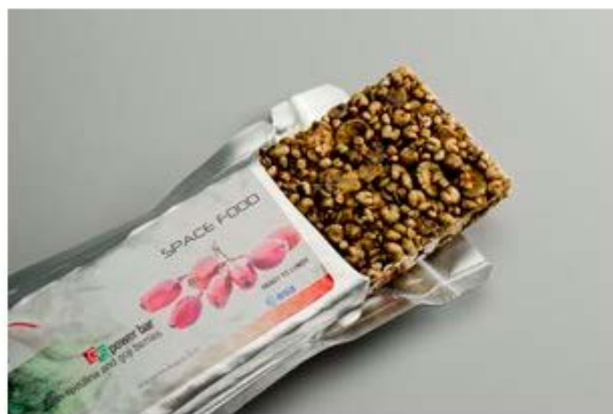
Astronautenvoedsel met Spirulina

31 augustus 2016 ESA's project MELISSA bestudeert al meer dan 25 jaar hoe men met bacteriën, algen, planten, chemische stoffen en natuurkundige processen van een ruimtetuig een gesloten ecosysteem kan maken. Dat onderzoek voor de ruimtevaart heeft vaak mooie toepassingen op de aarde. België is erbij.