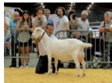
Moniek 56 is met haar 88 punten de hoogst ingeschreven geit van Cees.