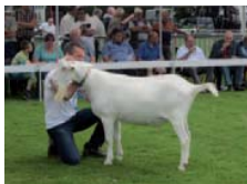
Van de bok Vladimir heeft Cees op dit moment drie lammeren.